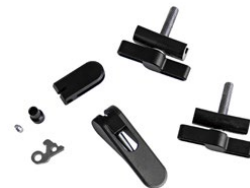
Aluminium Hinge Clamp And Rear Frame Clip Set