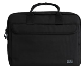
Metro City Bag M 12L / Q101585 / ¥27,500