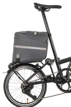
Borough Roller Rack Bag 14L / Q102983 / ¥19,096