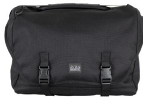
Metro Messenger Bag L 23L / Q101435 / ¥28,600