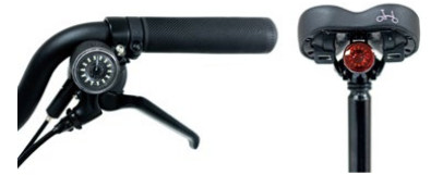
Be Seen Lights