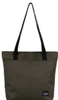
Borough Tote Bag S 9L / Q101581 / ¥16,500