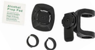
Phone Mount with Uni Adaptor