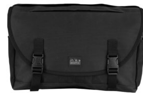
Metro Messenger Bag M 13L / Q101582 / ¥24,200