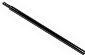
Extended Height Seatpost - Black