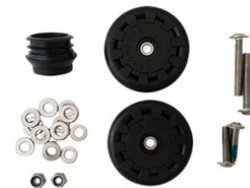
Eazy Wheel Rollers (6mm holes)