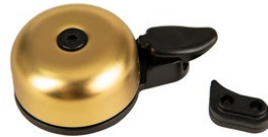
Integrated Bell - Brass