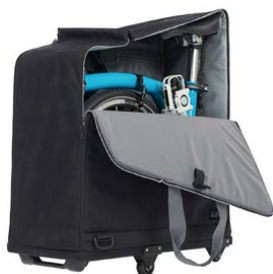
Padded Travel Bag Q100047 / ¥38,500