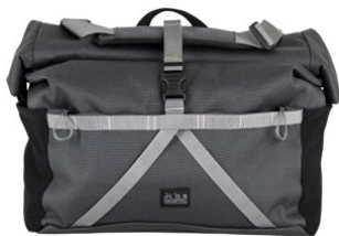
Borough Roll Top Bag L 28L / Q101500 / ¥28,600