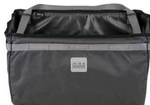
Borough Basket Bag L 23L / Q101498 / ¥22,000