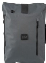
Borough Waterproof Backpack 17L / Q102864 / ¥37,499