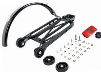
Rack set - Black