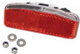
Rear Battery Lamp