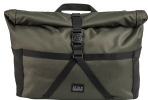
Borough Roll Top Bag M 14L / Q101583 / ¥24,200