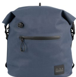
Borough Waterproof Bag S 9L / Q101580 / ¥22,000