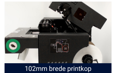
102mm brede printkop