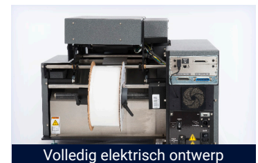
Volledig elektrisch ontwerp