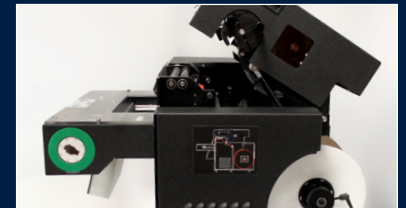
Tête d'impression de 102 mm de large