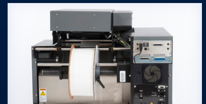
Conception entièrement électrique