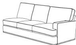
Sofa X1 Canapé X1 Sofá X1