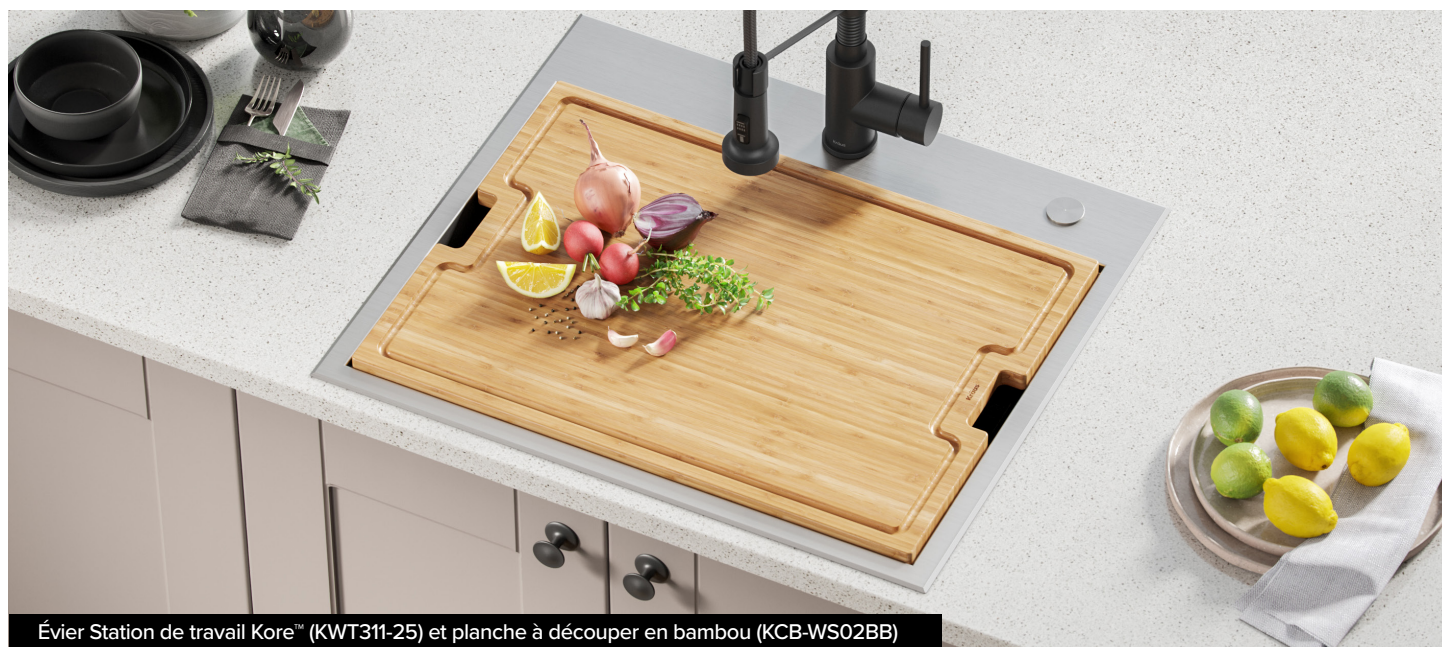
Évier Station de travail Kore™ (KWT311-25) et planche à découper en bambou (KCB-WS02BB)