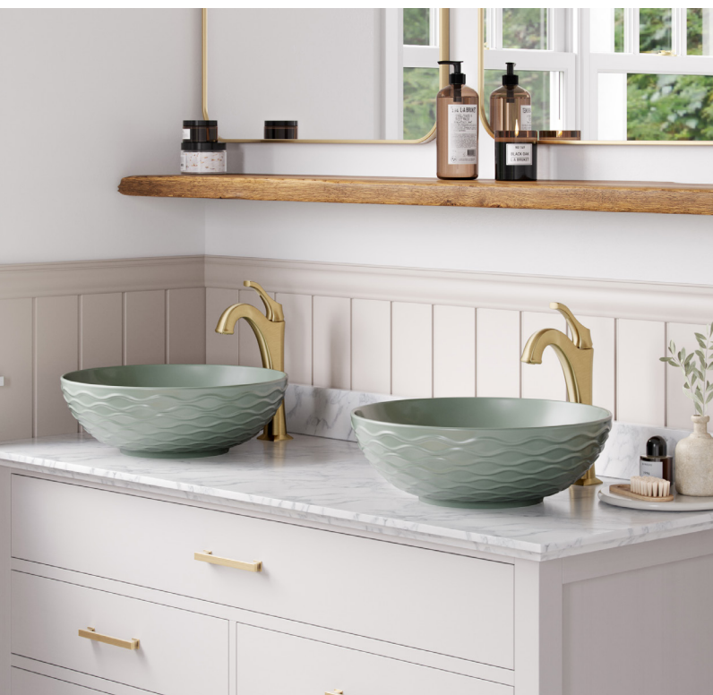
Vasque de salle de bain Viva™ en céramique porcelaine (KCV-200GGR)