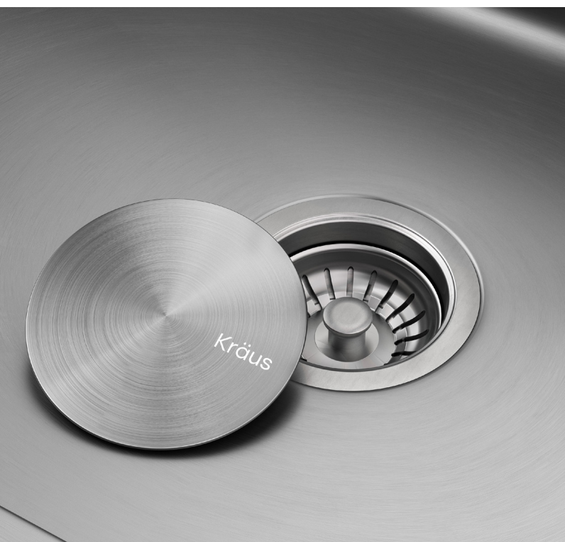
Couvercle décoratif et amovible de bonde CapPro™ (STC-2)