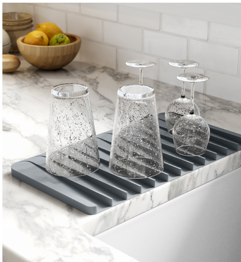
Tapis-égouttoir auto-drainant en silicone (KDM-10)