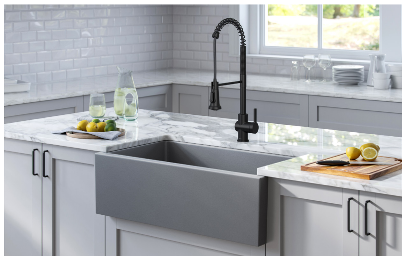
Évier de cuisine de ferme en argile réfractaire Turino™ 83,82 cm (33 po) (KFR1-33MGR)