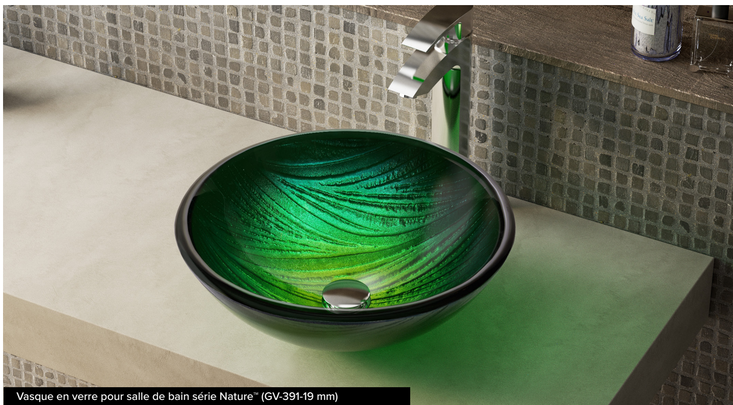
Vasque en verre pour salle de bain série Nature™ (GV-391-19 mm)