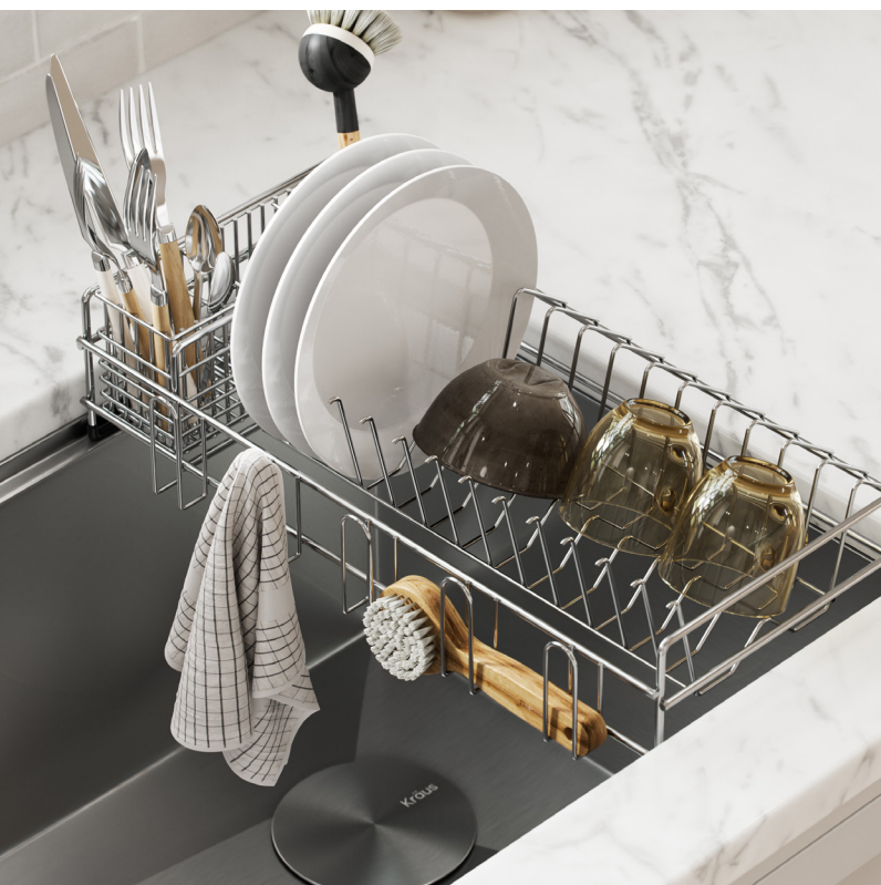
Égouttoir d'évier Station de travail (KDR-3)