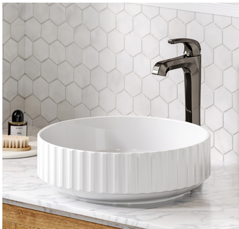
Vasque de salle de bain Viva™ en céramique porcelaine (KCV-201GWH)