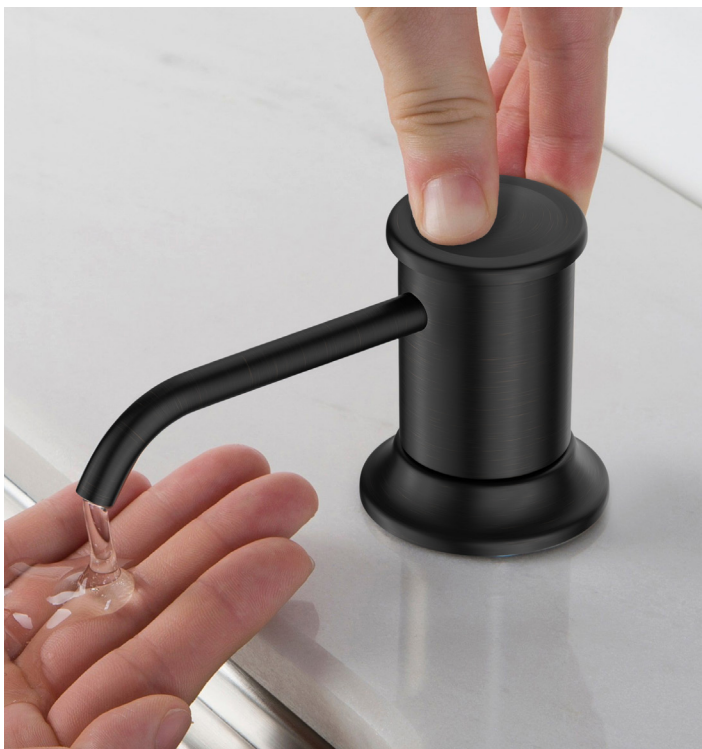
Distributeur de savon ou de lotion pour cuisine (KSD-80ORB)