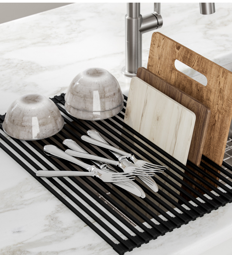
Égouttoir tout usage à dérouler sur l'évier (KRM-10)