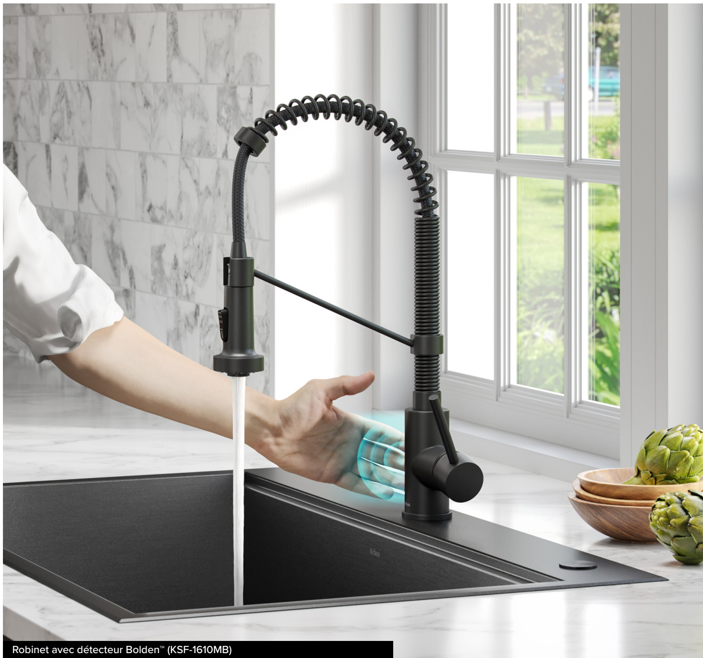
Robinet avec détecteur Bolden™ (KSF-1610MB)

Les robinets Kraus avec détecteur sont dotés de la fonctionnalité mains libres qui permet de minimiser les taches et les traces de doigt se produisant au fil du temps. Pour assurer le nettoyage et l'entretien de votre robinet avec détecteur, il vous suffit de suivre les instructions d'entretien pour les robinets de cuisine Kraus (avec fini Spot-Free ou tout autre fini) et d'apprécier cet avantage supplémentaire de la fonctionnalité mains libres pour une propreté ultime.