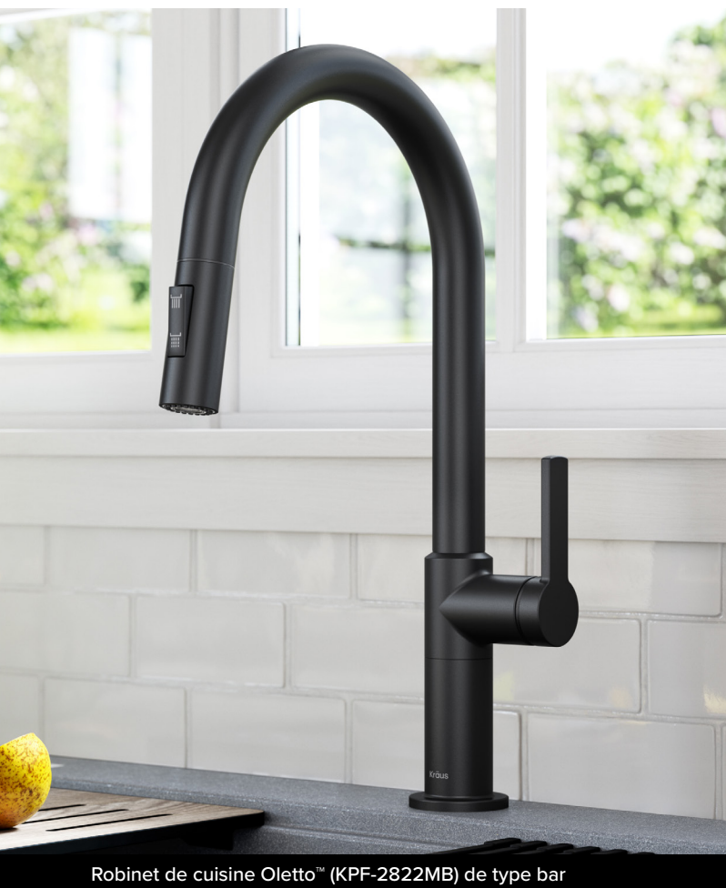
Robinet de cuisine Oletto™ (KPF-2822MB) de type bar