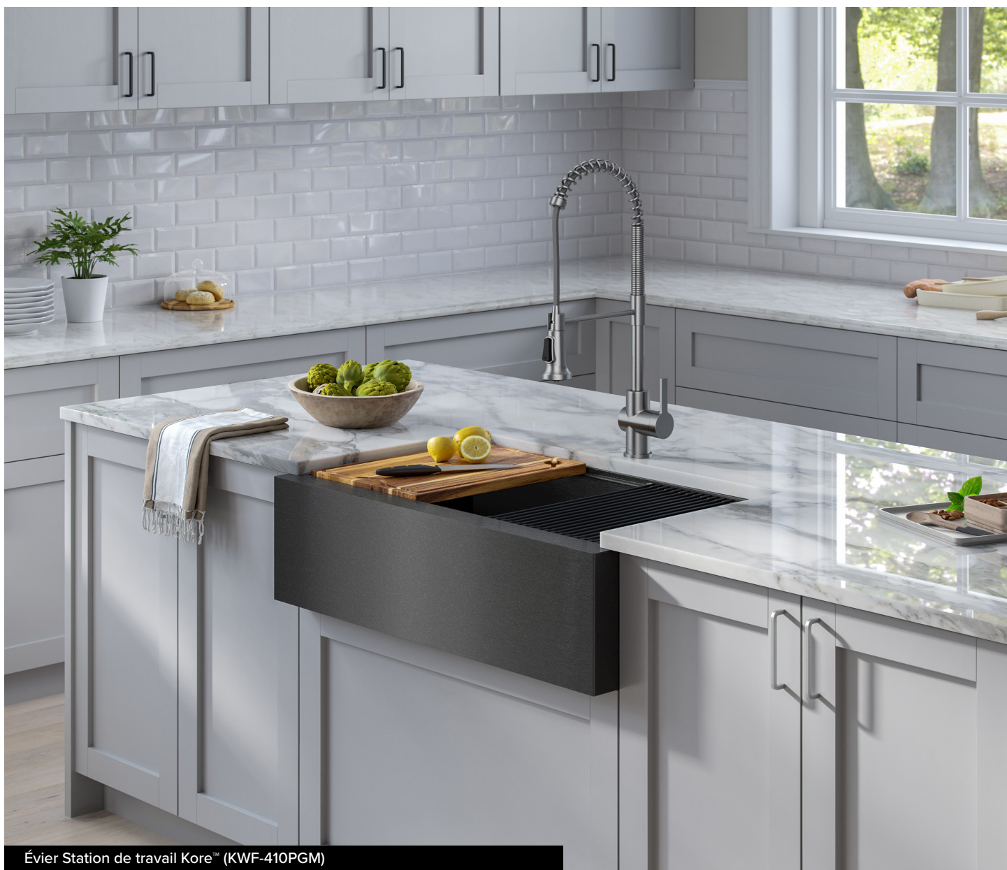
Évier Station de travail Kore™ (KWF-410PGM)

Les évier en PVD Kraus constituent dans toute cuisine, un élément phare de style moderne mais intemporel qui est étonnamment facile à entretenir. L'application du fini exclusif DuraShield™ résulte en un revêtement de couleur qui adhère complètement à l'évier et lui confère une durabilité inégalée outre une résistance supérieure à l'abrasion, aux ébréchures et à la corrosion. La texture mate passée au jet de sable résiste aux taches et aux traces de doigt de sorte que l'évier reste propre plus longtemps. L'entretien consiste tout simplement à essuyer la surface de l'évier avec un chiffon en microfibre après l'utilisation.