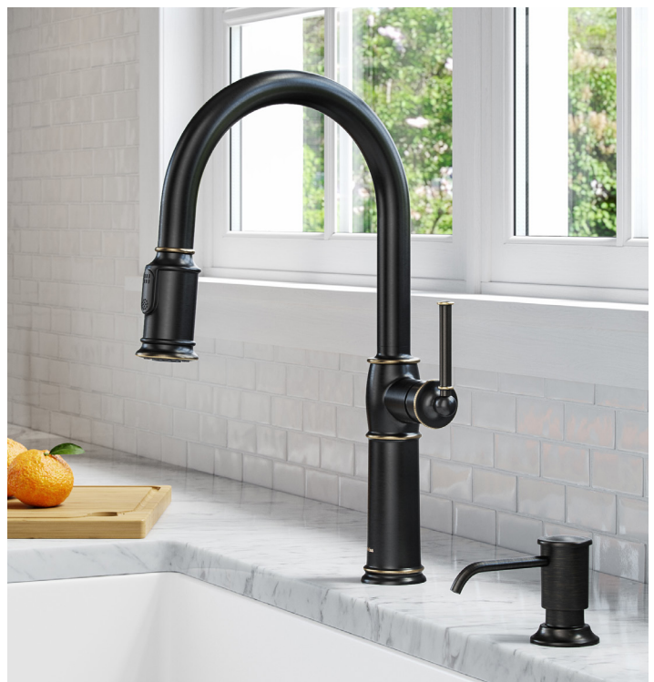
Distributeur de savon ou de lotion pour cuisine (KSD-80ORB)