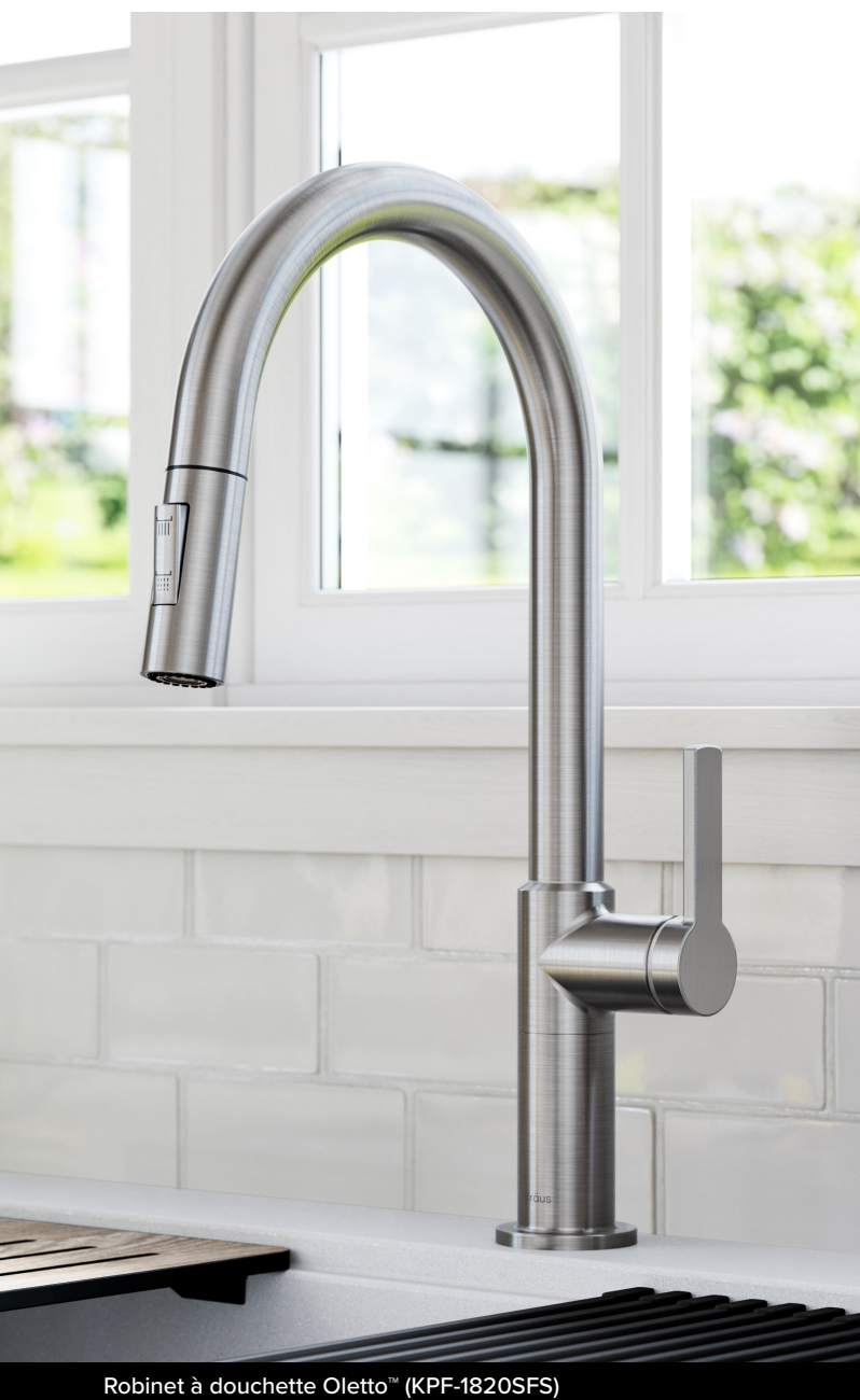
Robinet à douchette Oletto™ (KPF-1820SFS)

Faites en sorte que votre robinet semble neuf plus longtemps grâce au fini Spot-Free all-Brite™ qui nécessite moins de nettoyage et brille plus longtemps car il résiste aux taches d'eau, au ternissement et aux traces de doigt. Pour l'entretien courant des robinets all-Brite™, nous vous recommandons de nettoyer votre robinet avec du savon doux, de le rincer abondamment avec de l'eau tiède et de le sécher avec un chiffon propre et doux.