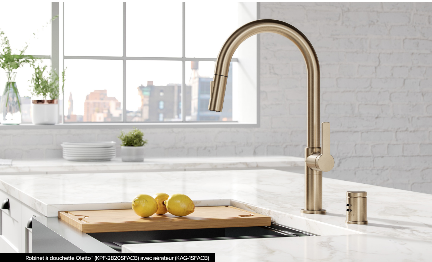
Robinet à douchette Oletto™ (KPF-2820SFACB) avec aérateur (KAG-1SFACB)