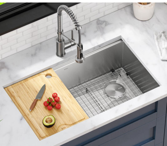
Évier Station de travail Kore™ (KWU110-32)