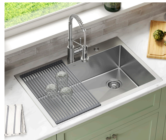
Évier encastré Loftén™ (KHT410-33)