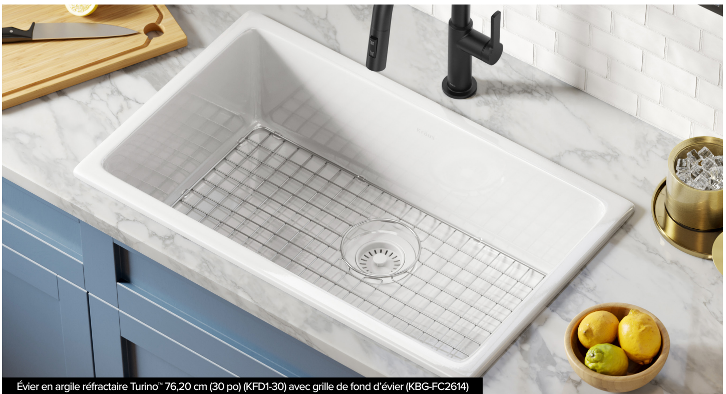
Évier en argile réfractaire Turino™ 76,20 cm (30 po) (KFD1-30) avec grille de fond d'évier (KBG-FC2614)