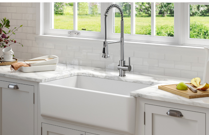
Évier de cuisine de ferme en argile réfractaire Turino™ 83,82 cm (33 po) (KFR1-33MWH)