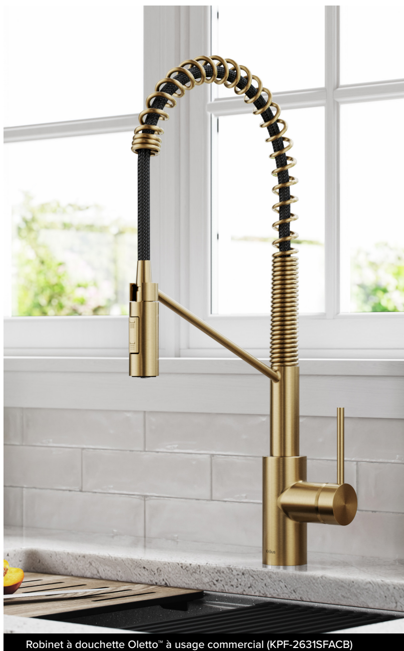
Robinet à douchette Oletto™ à usage commercial (KPF-2631SFACB)