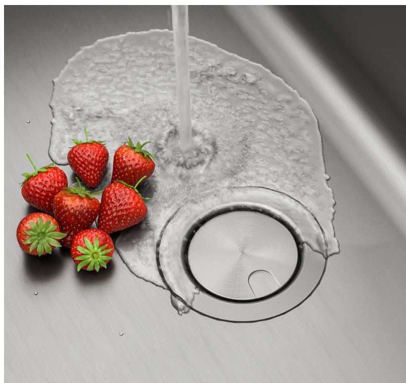
Assemblage de bonde en acier inoxydable avec crépine (ST-4)