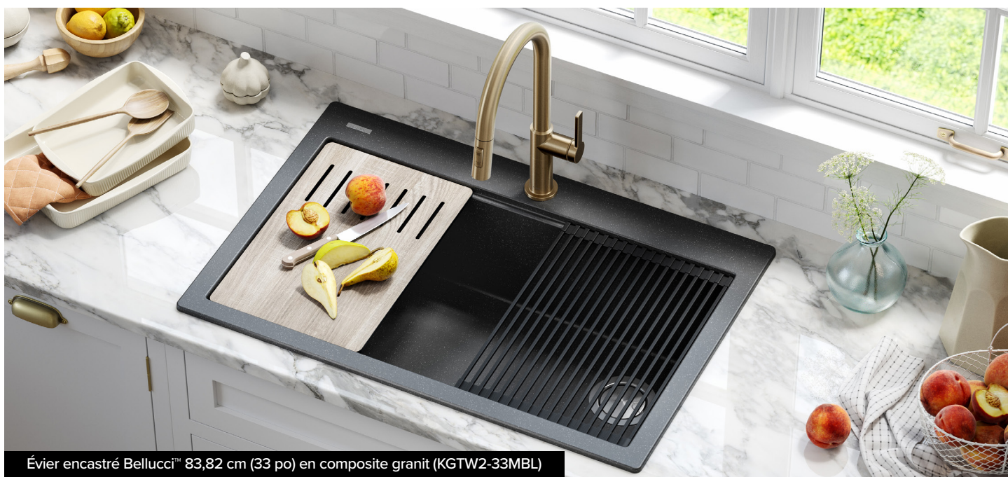
Évier encastré Bellucci™ 83,82 cm (33 po) en composite granit (KGTW2-33MBL)