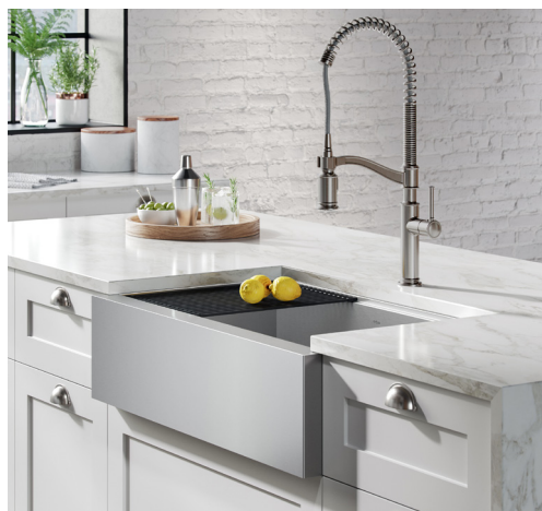
Évier Station de travail Kore™ (KWF410-33)