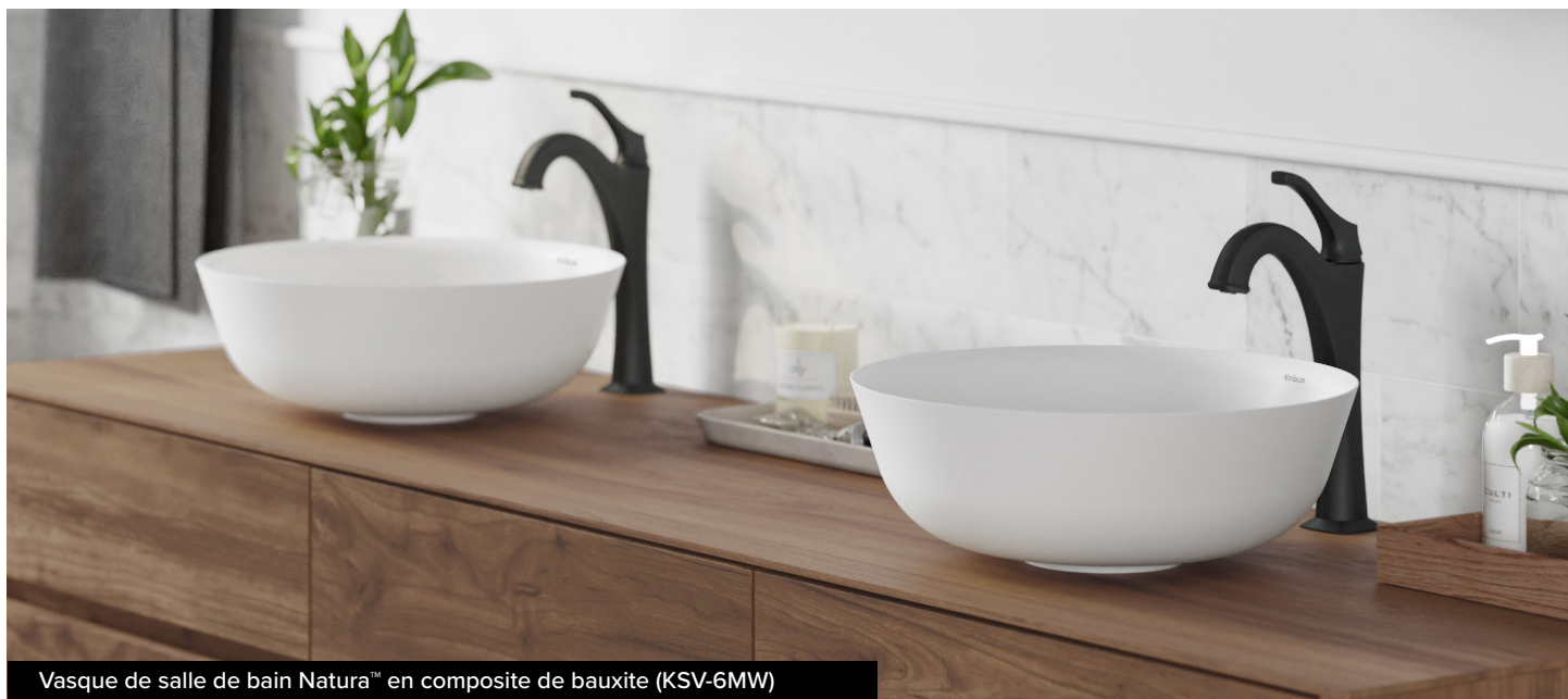
Vasque de salle de bain Natura™ en composite de bauxite (KSV-6MW)