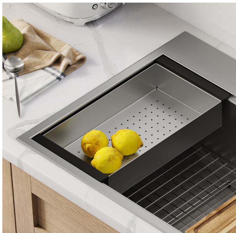
Passeoire en acier inoxydable pour évier Station de travail (CS-6)