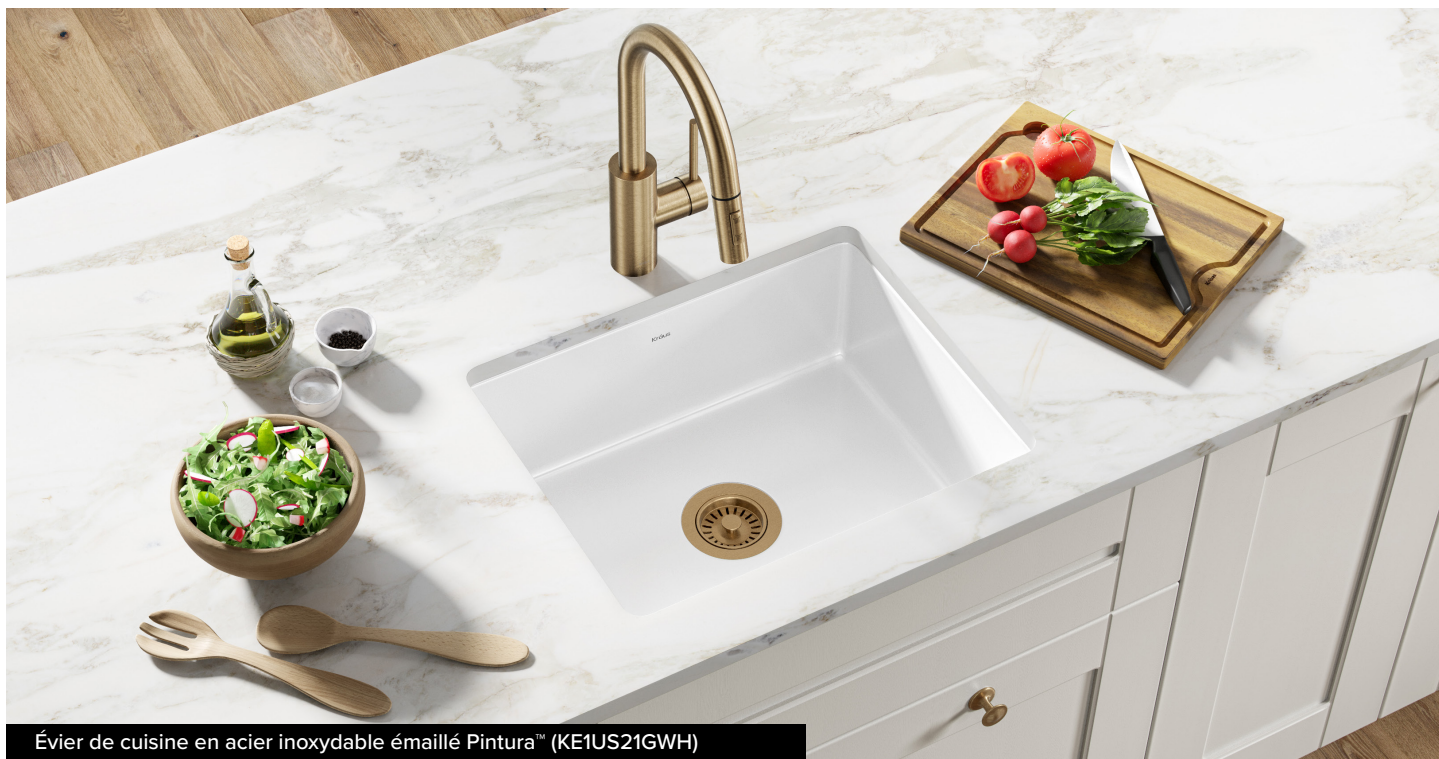
Évier de cuisine en acier inoxydable émaillé Pintura™ (KE1US21GWH)