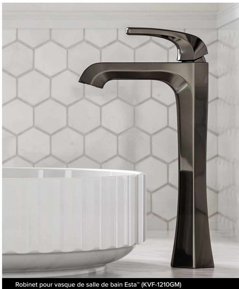
Robinet pour vasque de salle de bain Esta™ (KVF-1210GM)