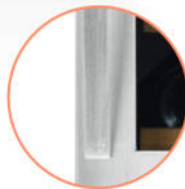
POIGNÉE DESIGN CURVE