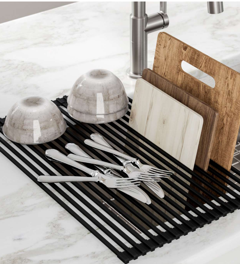
Égouttoir tout usage à dérouler sur l'évier (KRM-10)