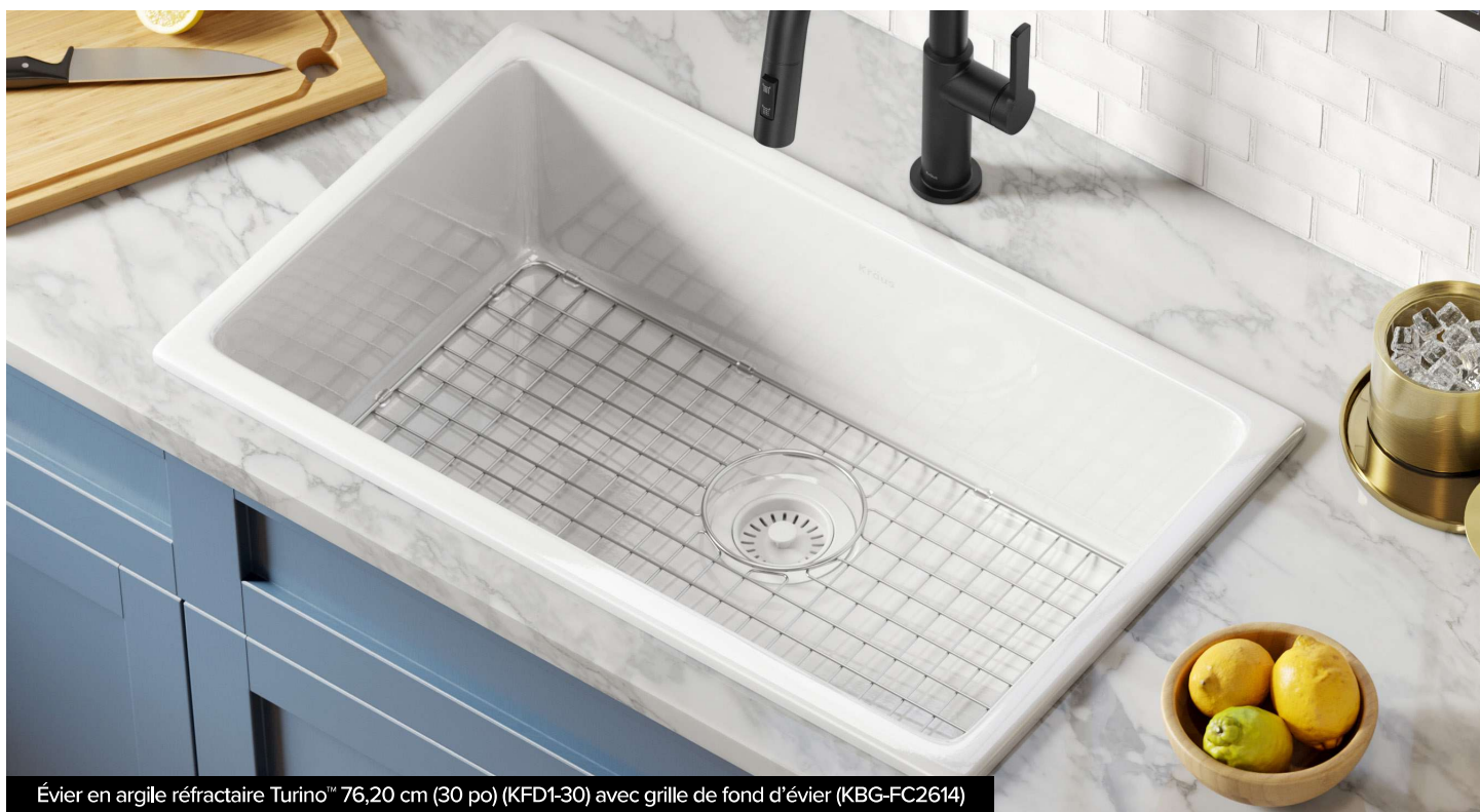
Évier en argile réfractaire Turino™ 76,20 cm (30 po) (KFD1-30) avec grille de fond d'évier (KBG-FC2614)