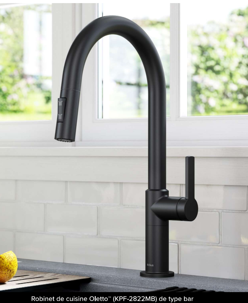
Robinet de cuisine Oletto™ (KPF-2822MB) de type bar