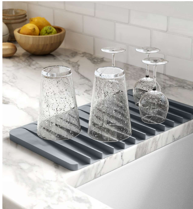
Tapis-égouttoir auto-drainant en silicone (KDM-10)