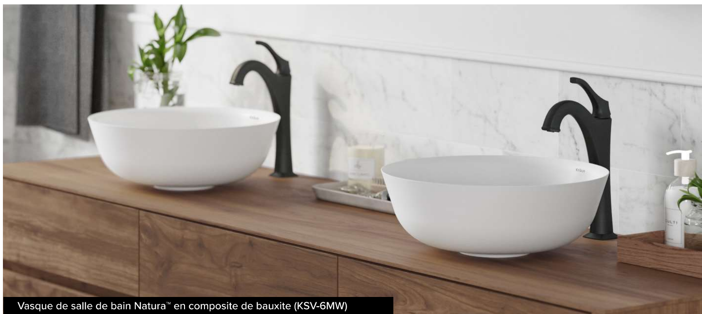
Vasque de salle de bain Natura™ en composite de bauxite (KSV-6MW)