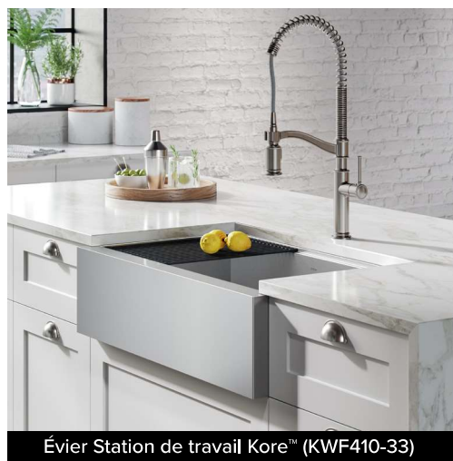
Évier Station de travail Kore™ (KWF410-33)