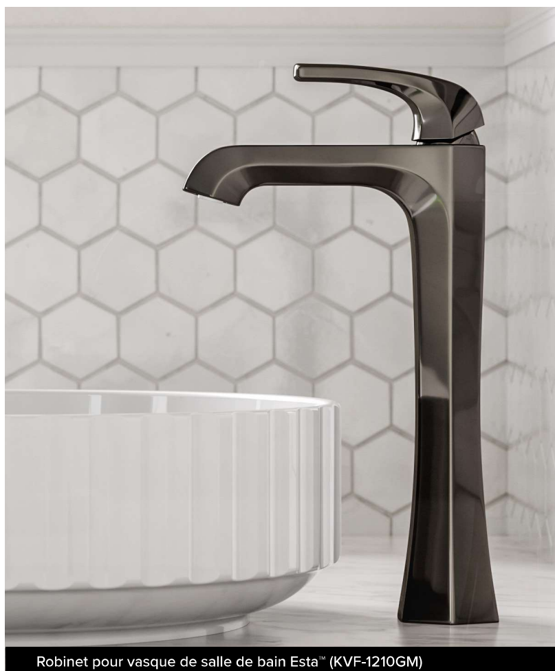
Robinet pour vasque de salle de bain Esta™ (KVF-1210GM)