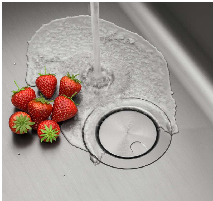
Assemblage de bonde en acier inoxydable avec crépine (ST-4)