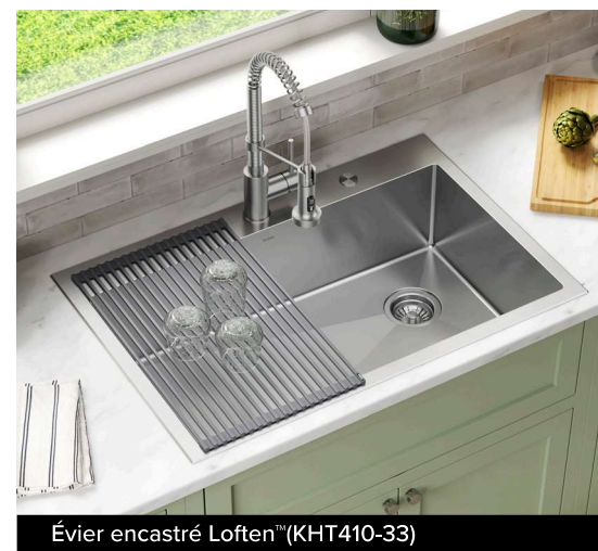
Évier encastré Loftén™ (KHT410-33)