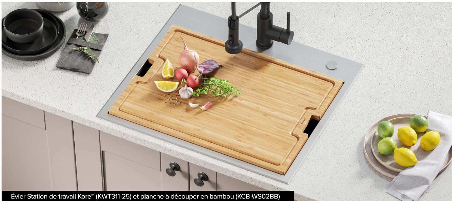
Évier Station de travail Kore™ (KWT311-25) et planche à découper en bambou (KCB-WS02BB)