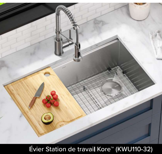
Évier Station de travail Kore™ (KWU110-32)