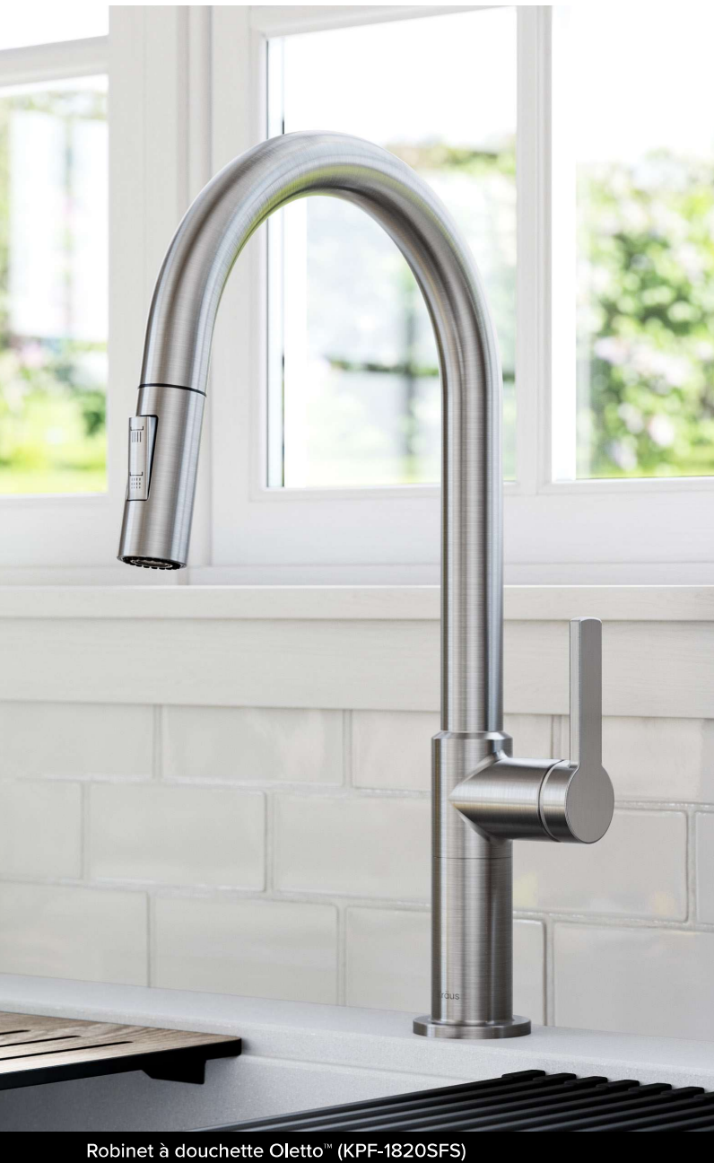
Robinet à douchette Oletto™ (KPF-1820SFS)

Faites en sorte que votre robinet semble neuf plus longtemps grâce au fini Spot-Free all-Brite™ qui nécessite moins de nettoyage et brille plus longtemps car il résiste aux taches d'eau, au ternissement et aux traces de doigt. Pour l'entretien courant des robinets all-Brite™, nous vous recommandons de nettoyer votre robinet avec du savon doux, de le rincer abondamment avec de l'eau tiède et de le sécher avec un chiffon propre et doux.