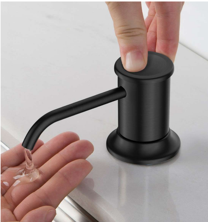
Distributeur de savon ou de lotion pour cuisine (KSD-80ORB)