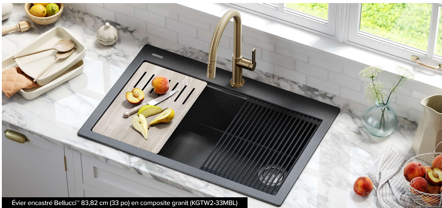
Évier encastré Bellucci™ 83,82 cm (33 po) en composite granit (KGTW2-33MBL)