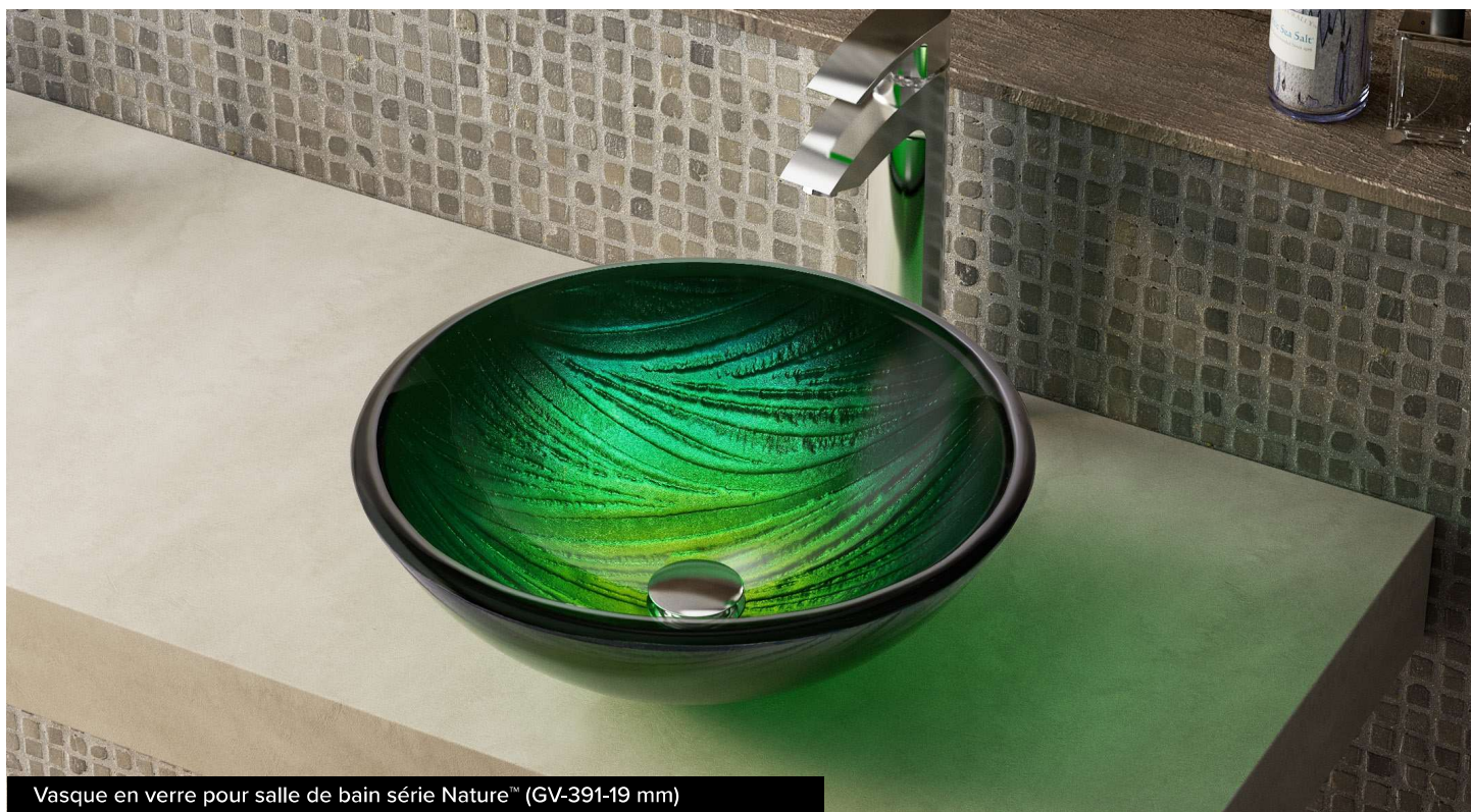
Vasque en verre pour salle de bain série Nature™ (GV-391-19 mm)