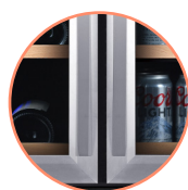
DESIGN CURVE HANDLE