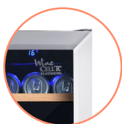
STAINLESS STEEL DOOR FRAME

* Les capacités sont approximatives et calculées avec des bouteilles de type bordeaux tradition.