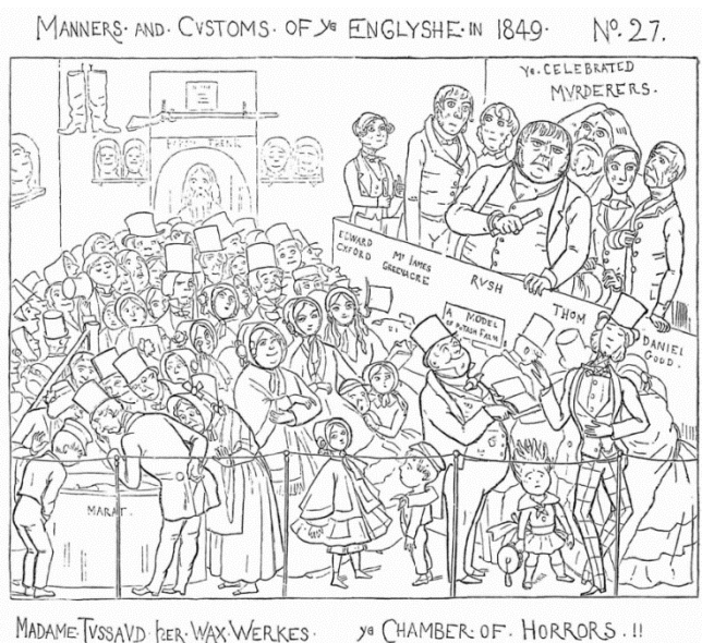
"Manners and Customs of Ye Englyshe in 1849 No. 27." Punch, vol. 17, no. 427, 15 Sept. 1849, p. 112. Punch Historical Archive, 1841-1992.

因为对一个事件、人物或犯罪案件的引用并不总是很明显的，所以仍应当在基于文字的检索后查看同一期杂志以及前后几期杂志的内容。“查看整页”和“查看整期”功能能够帮助研究者找到检索词（例如犯罪分子的名字）没有被提及的文章。例如，曼宁夫妇的名字并没有出现在理查德·道尔（Richard Doyle）的《1849 年英国人的风俗习惯，第 39 期：一次有趣的谋杀审判的刑事法庭现场》(Manners and Customs of Ye Englyshe in 1849 No. 39: Appearance of Ye Crymynal Court During an 'Interestyng' Tryal for Murder, 8 December 1849: 234)。随着中产阶级对伪中世纪式的历史习俗的追求，“风俗习惯”系列漫画逐渐流行起来。该系列漫画显示出公众对犯罪行为的偷窥欲与其他流行的消遣方式相类似，例如购物（《1849 年英国