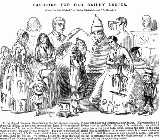
"La Mode Criminelle," or "Ladies' Criminal Chronicle" for November [Tom Taylor]. "Fashions for Old Bailey Ladies." Punch, vol. 17, no. 435, 10 Nov. 1849, p. 186. Punch Historical Archive, 1841-1992.

同样的检索词揭示出《笨拙》杂志将曼宁谋杀案、女性观众和女性时尚放在一起的有趣做法，这种现象其他杂志和报纸中也存在。1849年9月28日道格拉斯·杰罗尔德（Douglas Jerrold）发表的《贝克街的恐怖谋杀》（Horrid Murder in Baker Street", 29 September 1849: 123）一文是对杜莎夫人蜡像馆（Madame Tussaud's）的诙谐控诉，强调了对年轻女性痴迷于惊悚犯罪的担忧。杰罗尔德的《老贝利街的女士们》（Old Bailey Ladies, 3 November 1849: 181）一文再次刻意引用了曼宁案件，文中一位年轻女子写信给她的朋友，谈及她在旁听审判时看到的时髦服饰。《老贝利街的女士们》呼应了媒体对审判时玛利亚·曼宁头戴黑色面纱、身着黑裙