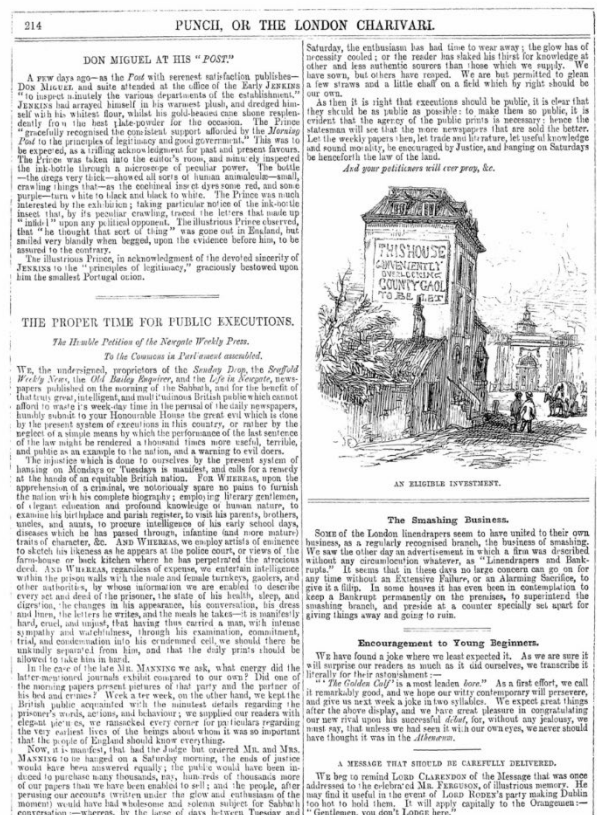
"The Proper Time for Public Executions." Punch, vol. 17, no. 438, 1 Dec. 1849, p. 214. Punch Historical Archive, 1841-1992.

在“《笨拙》杂志历史典藏”中用“Manning”、“Mannings”或“Maria Manning”进行基本检索，返回大量对这个案件的直接引用，包括1849年12月1日威廉·梅克比斯·萨克雷 4 （William Makepeace Thackeray）题为《公开处决的好时机》（The Proper Time for Public Executions, 1 December 1849: 214）一文。萨克雷批评了纽盖特（Newgate）监狱小说中对犯罪和罪犯的美化，以本文讽刺了媒体美化公开处决并从中获益的行为 5 。九年前的1840年7月6日，萨克雷目睹并记录了另一个臭名昭著的杀手库瓦西耶（Courvoisier）的处决 6 。萨克雷的文章《去看一个被绞死的人》（Going to See a Man Hanged），发表在1840年8月一期的政治进步月刊《弗雷泽杂志》（Fraser's Magazine, 1830-1882年） 7 上。文中他描述自己的感到“羞愧和耻辱，残忍的好奇心将我带到了这个残忍的场景中” 8 。此外，他也提到了他的小说家同行“博兹”（Boz）查尔斯·狄更斯，也在库瓦西耶处决的现场 9 。学者们并未达成一致，萨克雷是希望废除死刑还是仅仅希望死刑现场不要再对公众开放，但显然他的想法发生了转变 10 。狄更斯也是一样。曼宁被绞死后，狄更斯写信