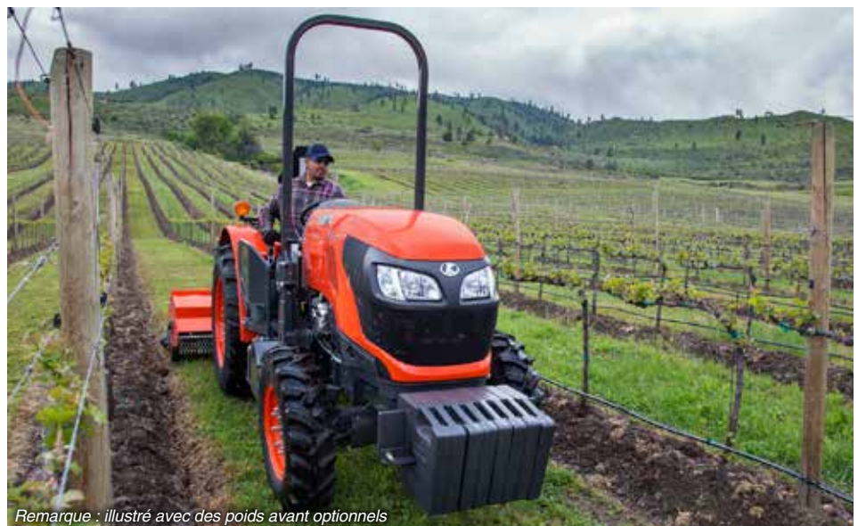
Remarque : illustré avec des poids avant optionnels