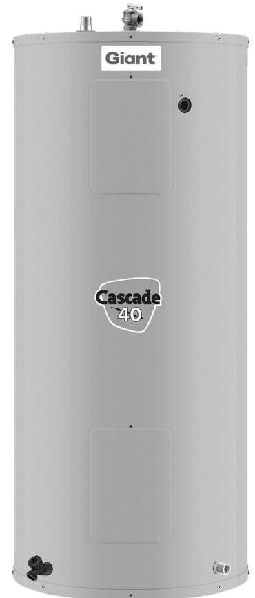
Modèle illustré: 152B-3F7M