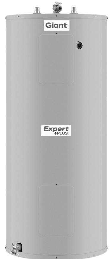
Modèle illustré: 152STE-3S8M-E8