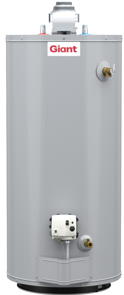
Modèle illustré: UG40-40SD3-N2 100