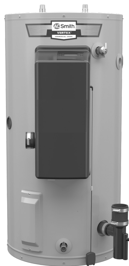
MODÈLE ILLUSTRÉ: GPCC-40L

*Conditions pour débit d'eau chaude en continu: chauffe-eau de 65 000 BTU/h, débit de douche de 2,8 GPM, température d'eau froide de 65°F, température d'eau chaude de 110°F, chauffe-eau installé selon les directives du fabricant.