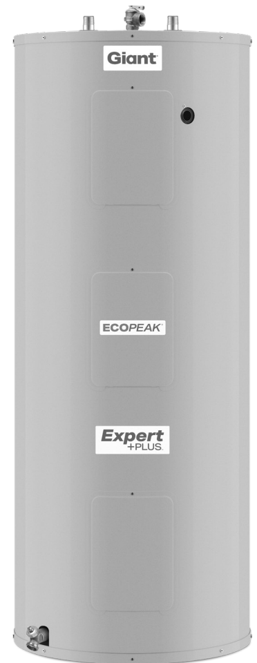
Modèle illustré: 172STPS-3S8M-E8