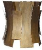
A - 1 pcs