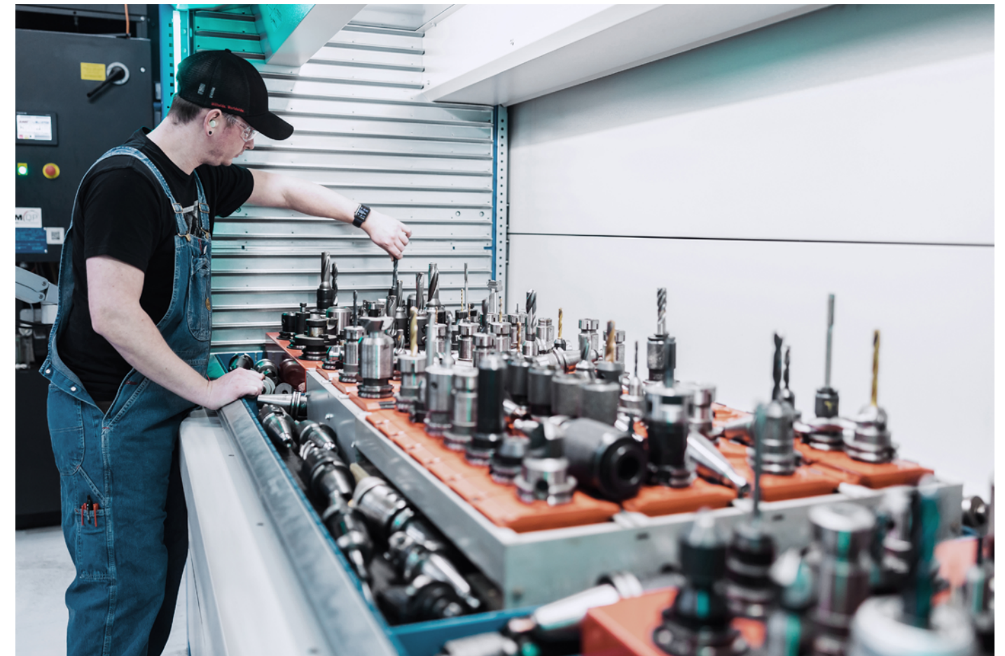
Skladování nářadí s Kardex Shuttle

K dispozici jsou další možnosti např: skladovací prostředí s klimatizací, skladování v čistém prostředí, s protipožární nebo ESD ochranou.