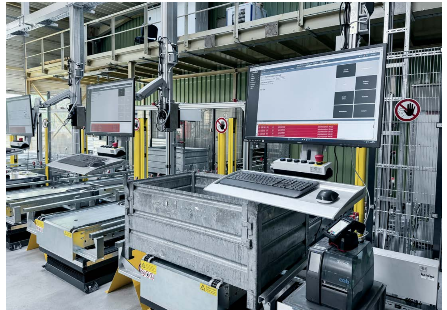
Kommissionierung vorher und nachher. Gewonnen hat auch die Kommissionierung: Dort wird jetzt an fünf ergonomischen, höhenverstellbaren Arbeitsplätzen gepickt.

In der Kommissionierung wird jetzt an fünf ergonomischen, höhenverstellbaren Arbeitsplätzen gepickt. An den zwei neu gestalteten Auf- und Abnahmeplätzen macht sich das neue Konzept gleichermaßen bemerkbar: Durch den Wegfall der Meisterkabine wurde Platz für Stellplätze geschaffen.