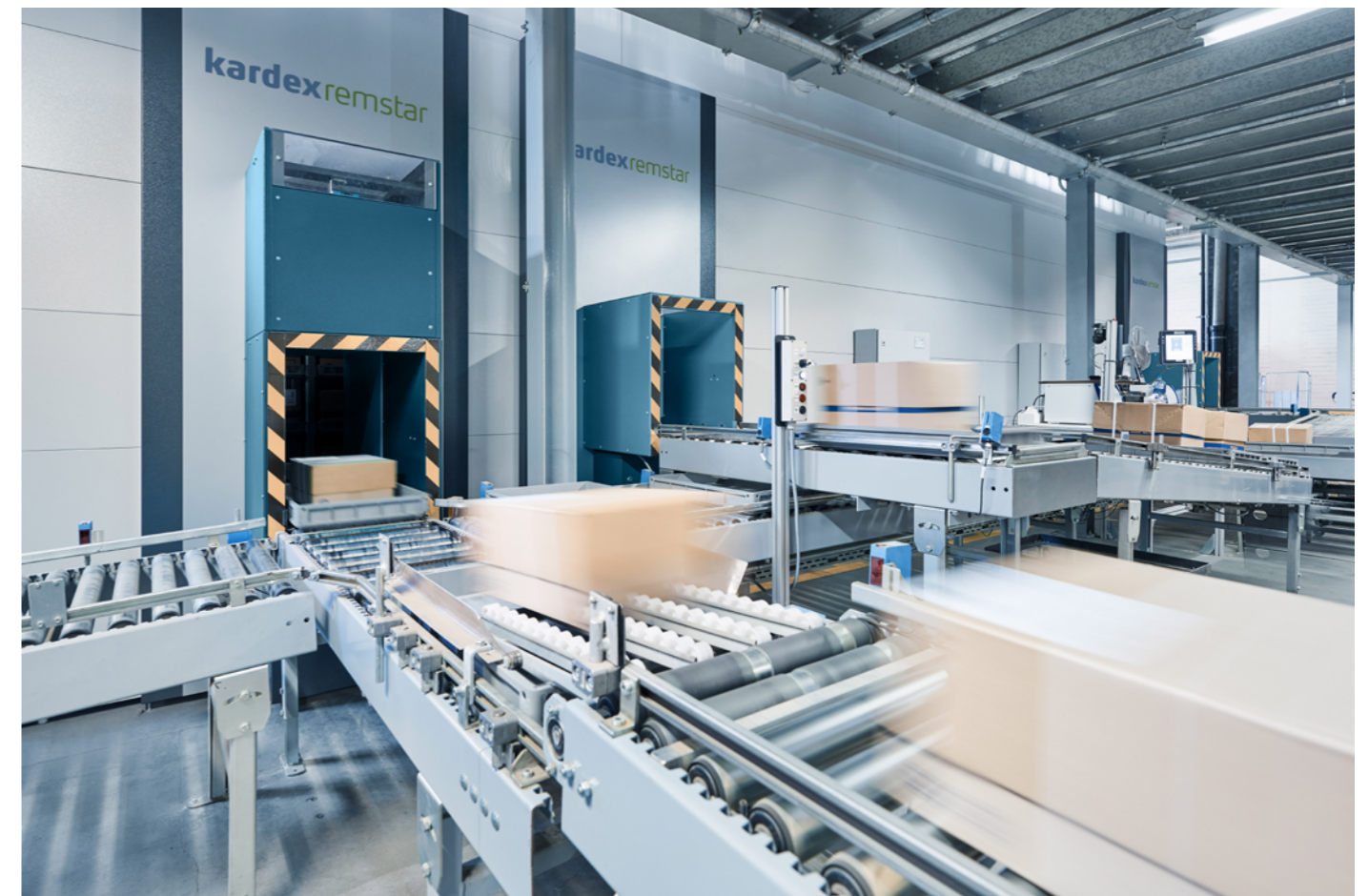
Auftragskonsolidierung mit automatischer Fördertechnikbindung