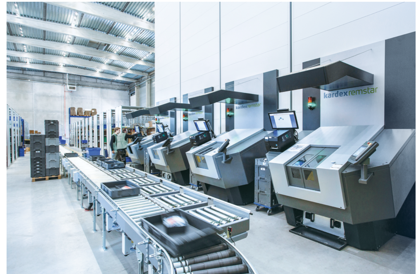
Kommissionierung mit Drehtischen und Fördertechnik mit Ablageplätzen

Weitere Optionen und Lagerumgebungen mit Klimatisierung, Brandschutz oder ESD-Ausführung sind ebenfalls verfügbar.