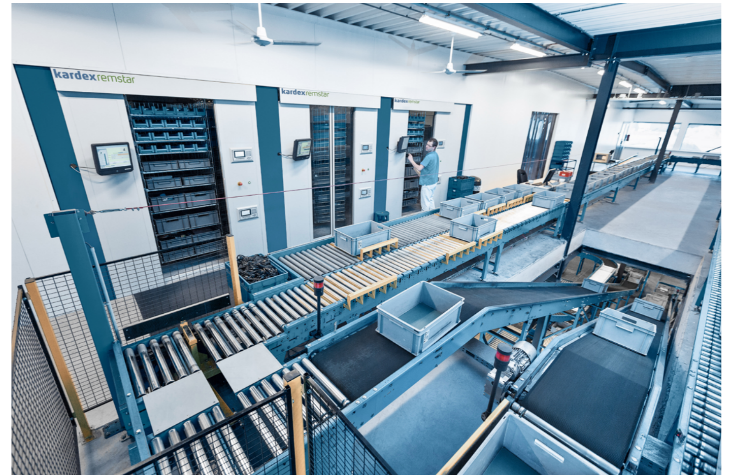
Unidades Kardex Horizontal Carousel con sistema transportador

Además de opciones de equipamiento, también hay disponibles entornos de almacenamiento con aire acondicionado o protección contra incendios, así como versiones ESD.