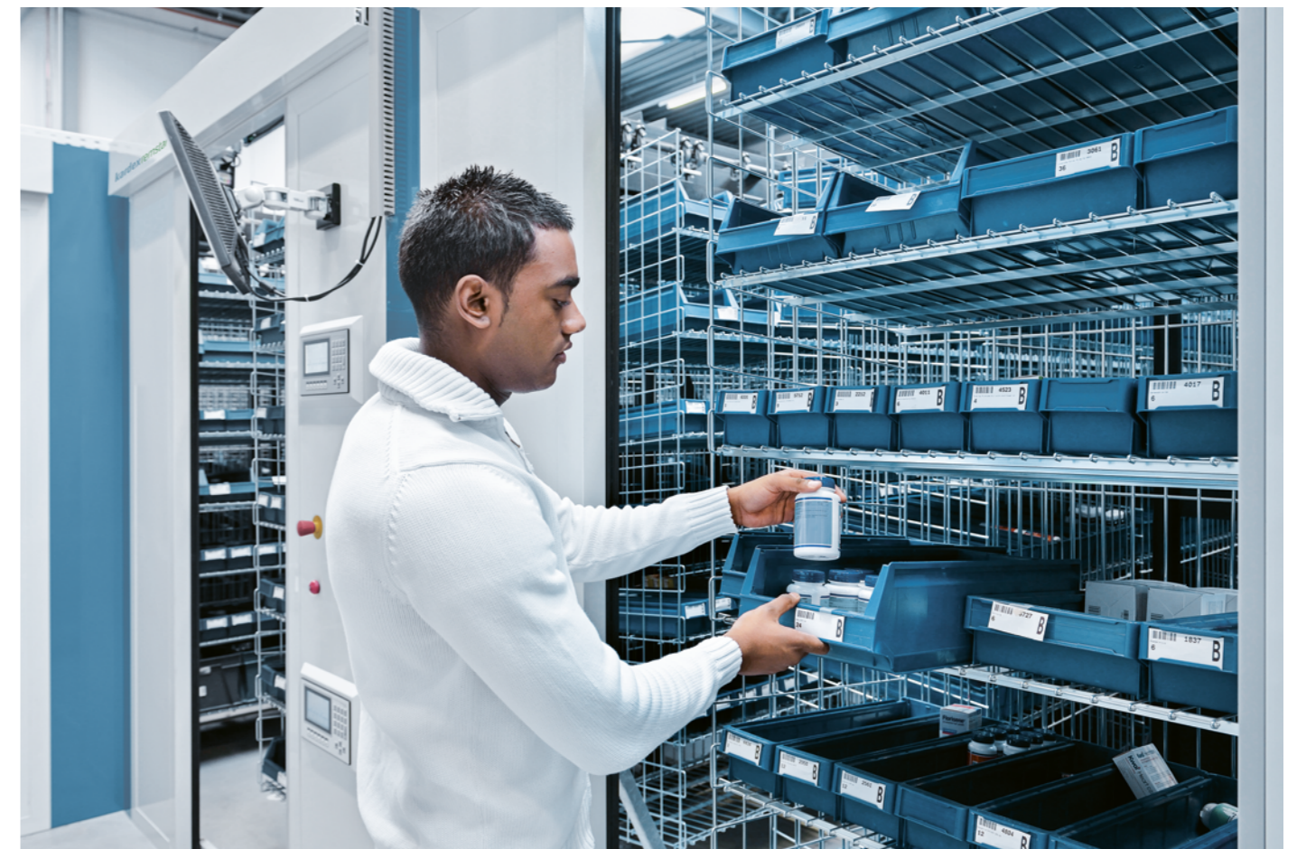
Picking con unidades Kardex Horizontal Carousel