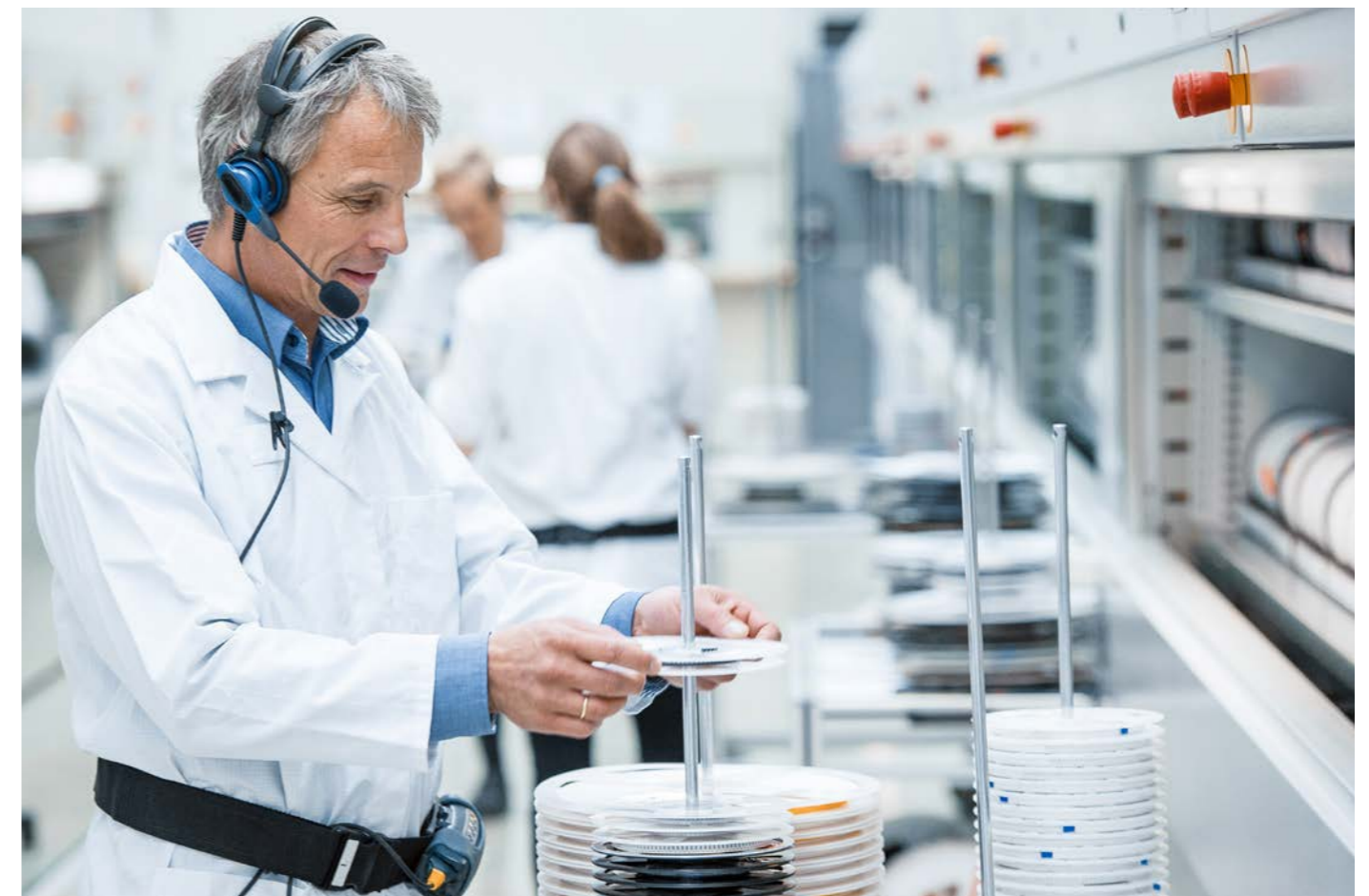
Obsługa SMD za pomocą modułów Kardex Megamat