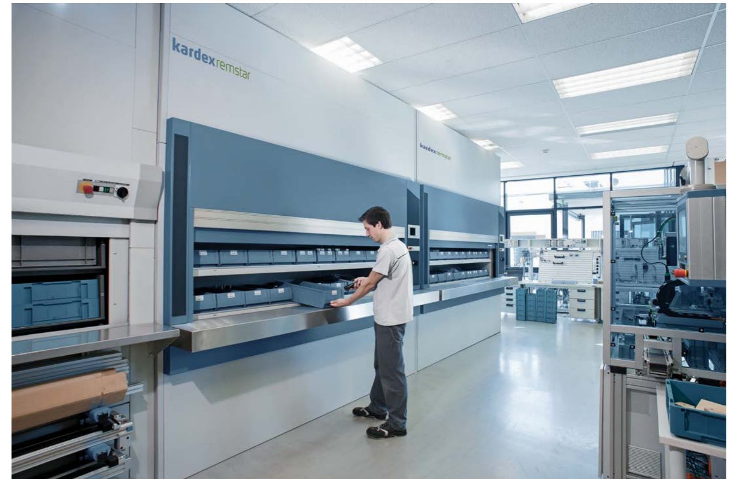
Zarządzanie częściami zamiennymi za pomocą modułów Kardex Megamat

Dostępne są opcje wykonania urządzenia dedykowane dla różnych środowisk magazynowych a w tym wyposażone w klimatyzację, dostosowanie do pomieszczeń czystych (klasy ISO), z zabezpieczeniami przeciwpożarowymi oraz zabezpieczeniami chroniącymi przed wyładowaniami elektrostatycznymi.