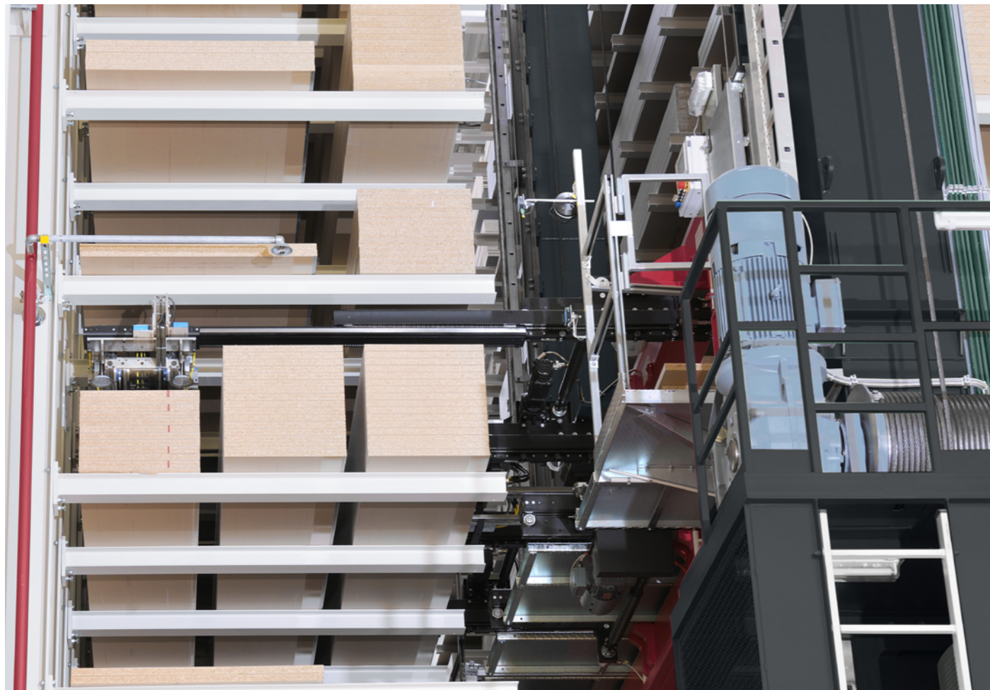
Les panneaux sont directement prélevés dans l'entrepôt à l'aide de traverses à ventouses

Tout comme la plateforme automotrice, le transtockeur entièrement automatique dispose d'une traverse à ventouses comme préhenseur. Les entrepôts de grande hauteur permettent de stocker beaucoup plus d'articles dans un espace réduit, et ainsi de minimiser les distances et les temps de trajet, ce qui se traduit par d'énormes cadences de picking. Un fabricant de cuisines allemand a atteint des sommets dans ce domaine sur l'un de ses sites de production.