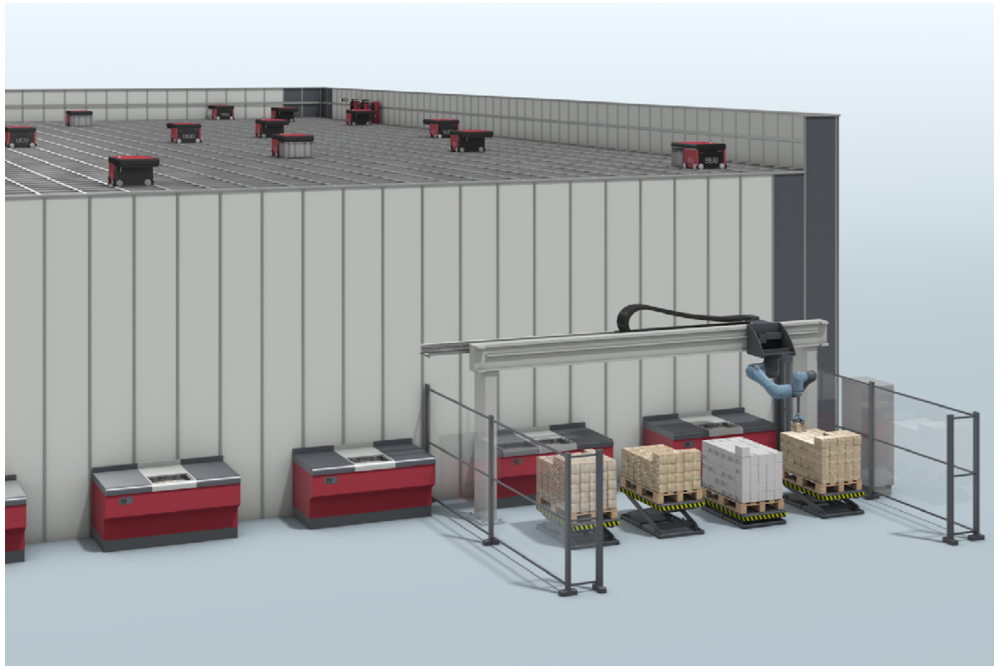
Zautomatyzowane rozwiązanie z robotem pobierająco-odkładającym do (de)paletyzacji