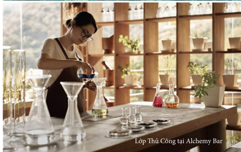
Lớp Thủ Công tại Alchemy Bar