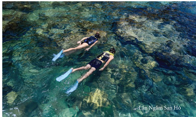
Lặn Ngắm San Hô