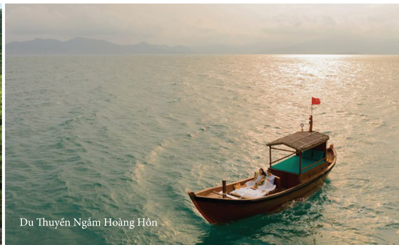
Du Thuyền Ngắm Hoàng Hôn