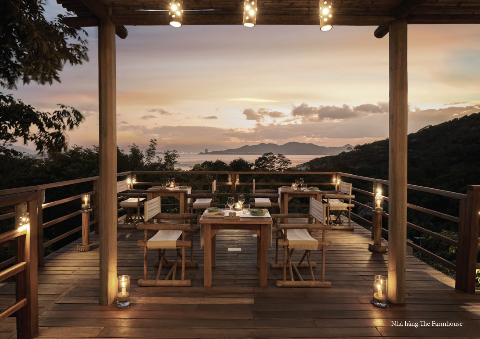
Nhà hàng The Farmhouse