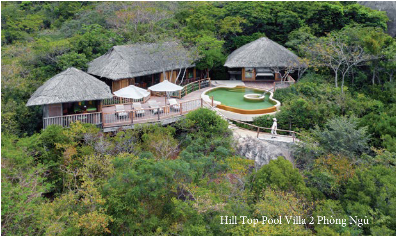
Hill Top Pool Villa 2 Phòng Ngủ