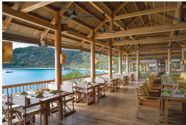
Dining by the Bay

Với thiết kế mở và thoáng đãng, đây là địa điểm lý tưởng mang đến trải nghiệm ẩm thực hòa quyện với thiên nhiên giữa trời sao và trăng sáng, hoàn hảo cho một bữa ăn lãng mạn và ấm cúng.