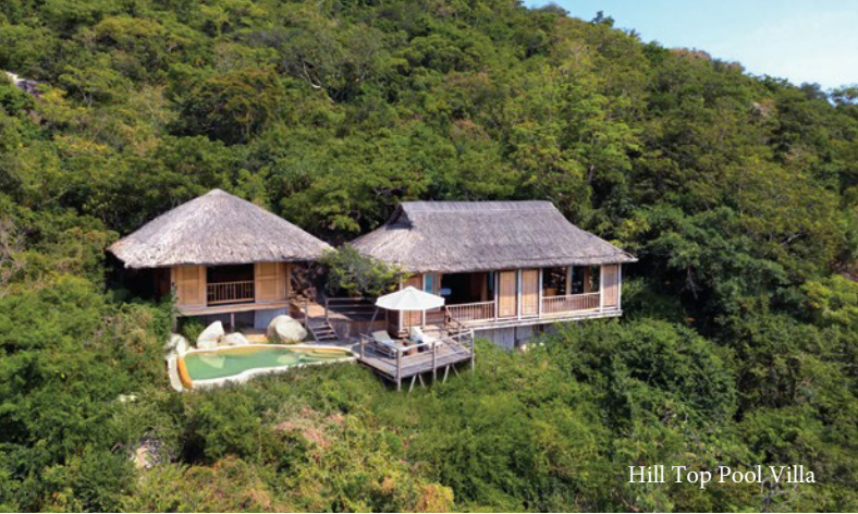
Hill Top Pool Villa