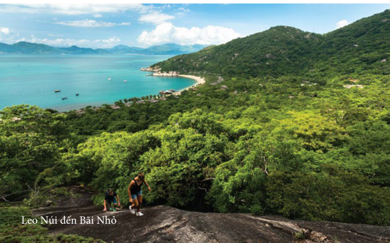
Leo Núi đến Bãi Nhỏ

Dạo quanh Vịnh Nha Phu trên một chiếc thuyền gỗ, thưởng thức rượu vang sủi cùng các món ăn nhẹ. Nâng ly chúc mừng khi mặt trời dần khuất sau Biển Đông và dẫn lối cho hoàng hôn ghé thăm vùng vịnh, hé mở khoảnh khắc hoàn hảo để cầu hôn hoặc đơn giản là đắm chìm vào giây phút lãng mạn cùng người thương.