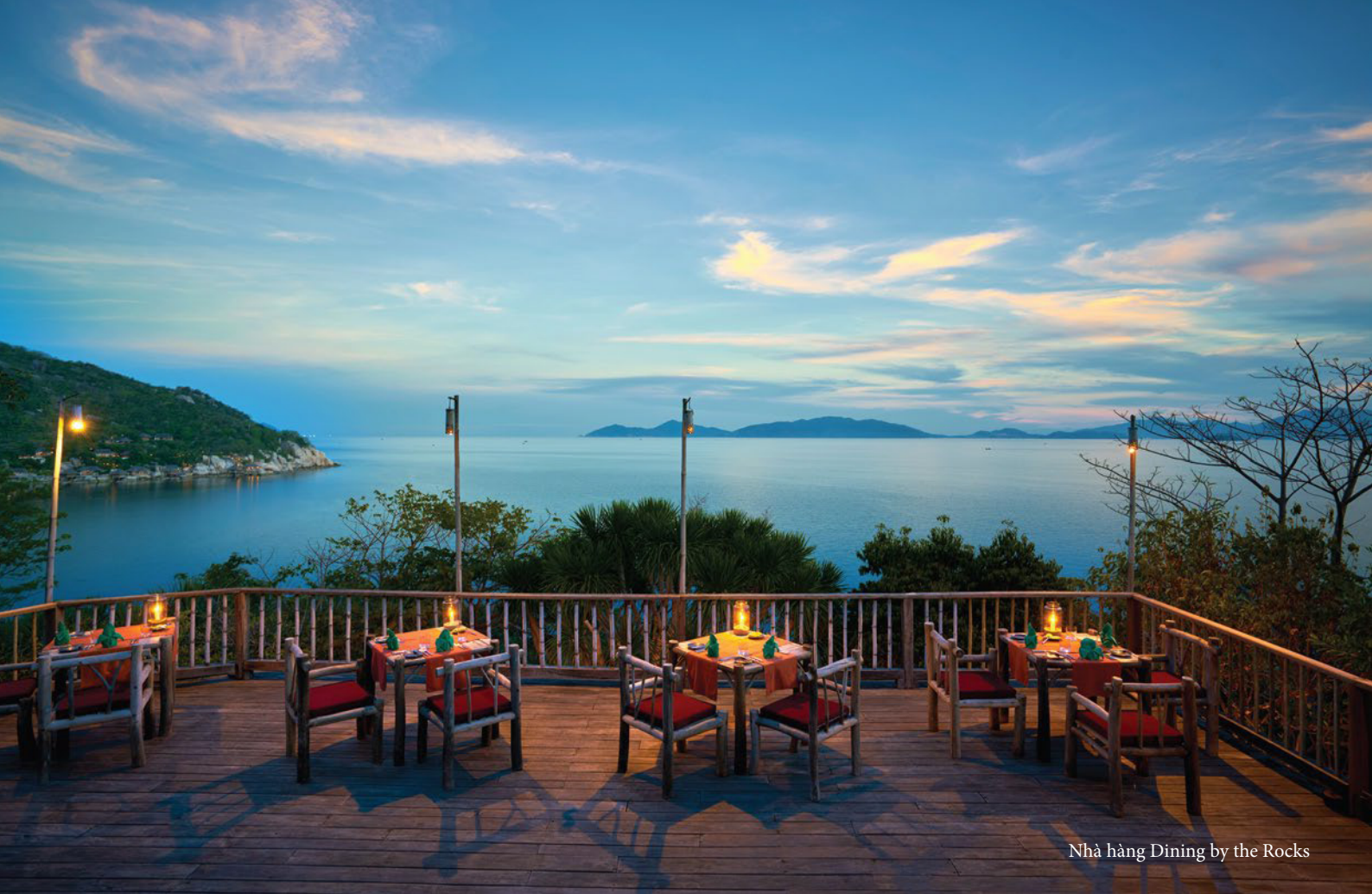
Nhà hàng Dining by the Rocks