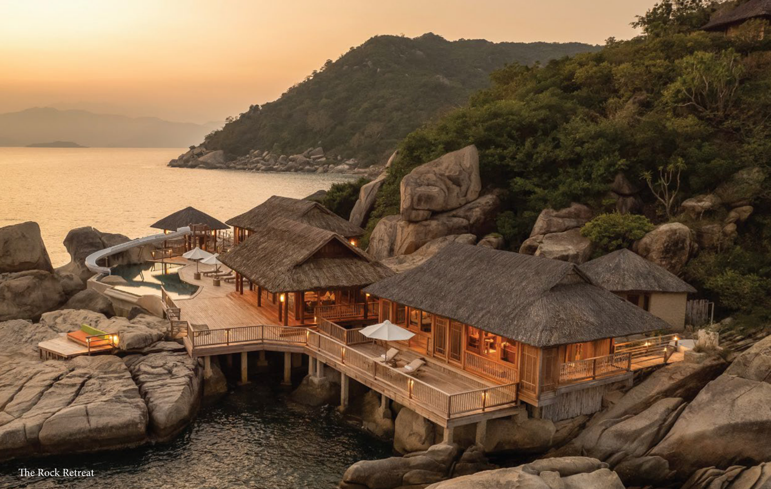
The Rock Retreat