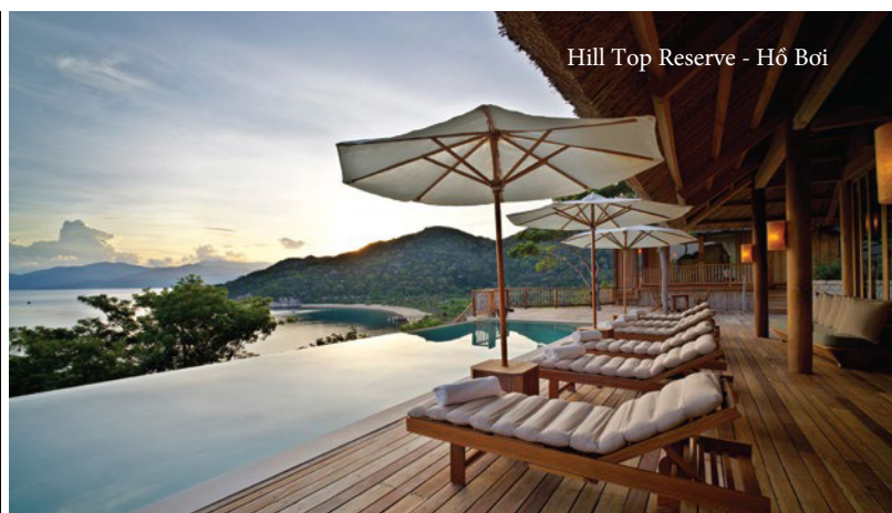
Hill Top Reserve - Hồ Bơi