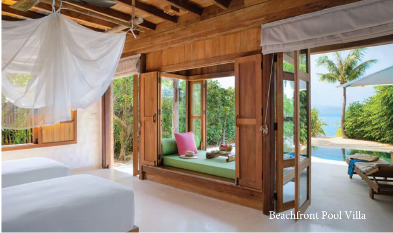
Beachfront Pool Villa