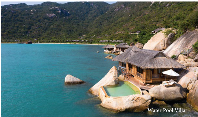
Water Pool Villa