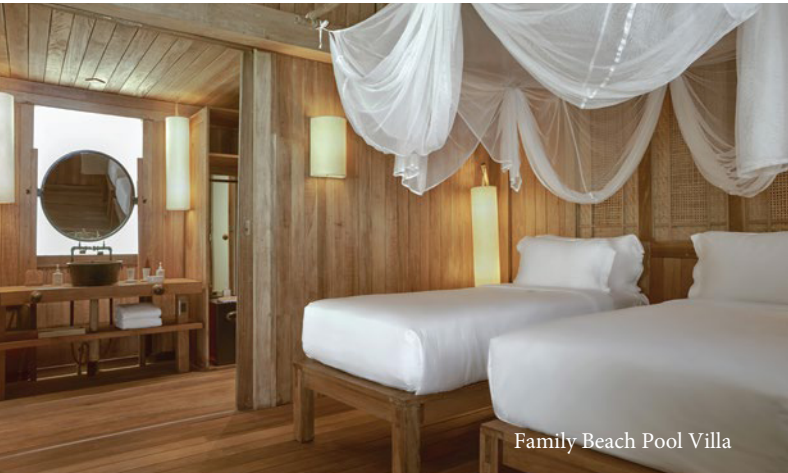
Family Beach Pool Villa