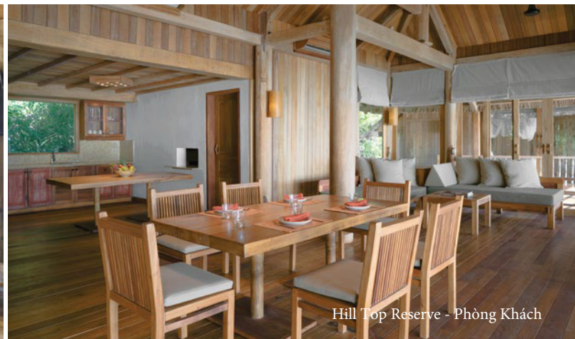
Hill Top Reserve - Phòng Khách