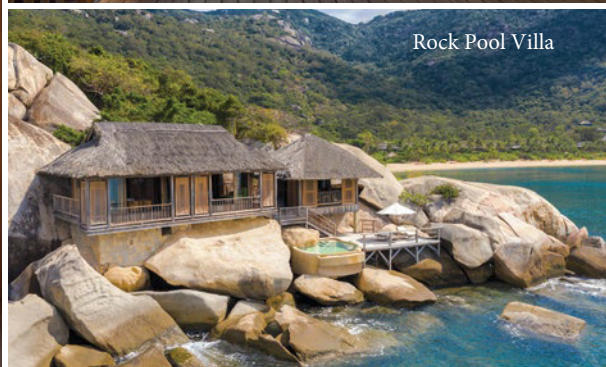
Rock Pool Villa