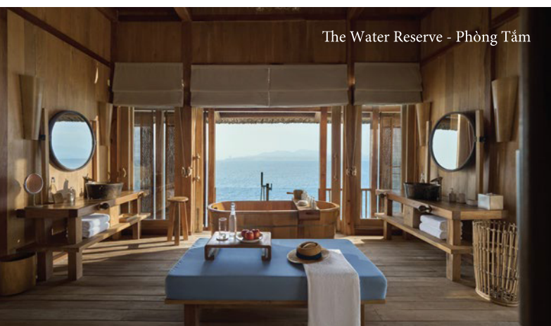
The Water Reserve - Phòng Tắm