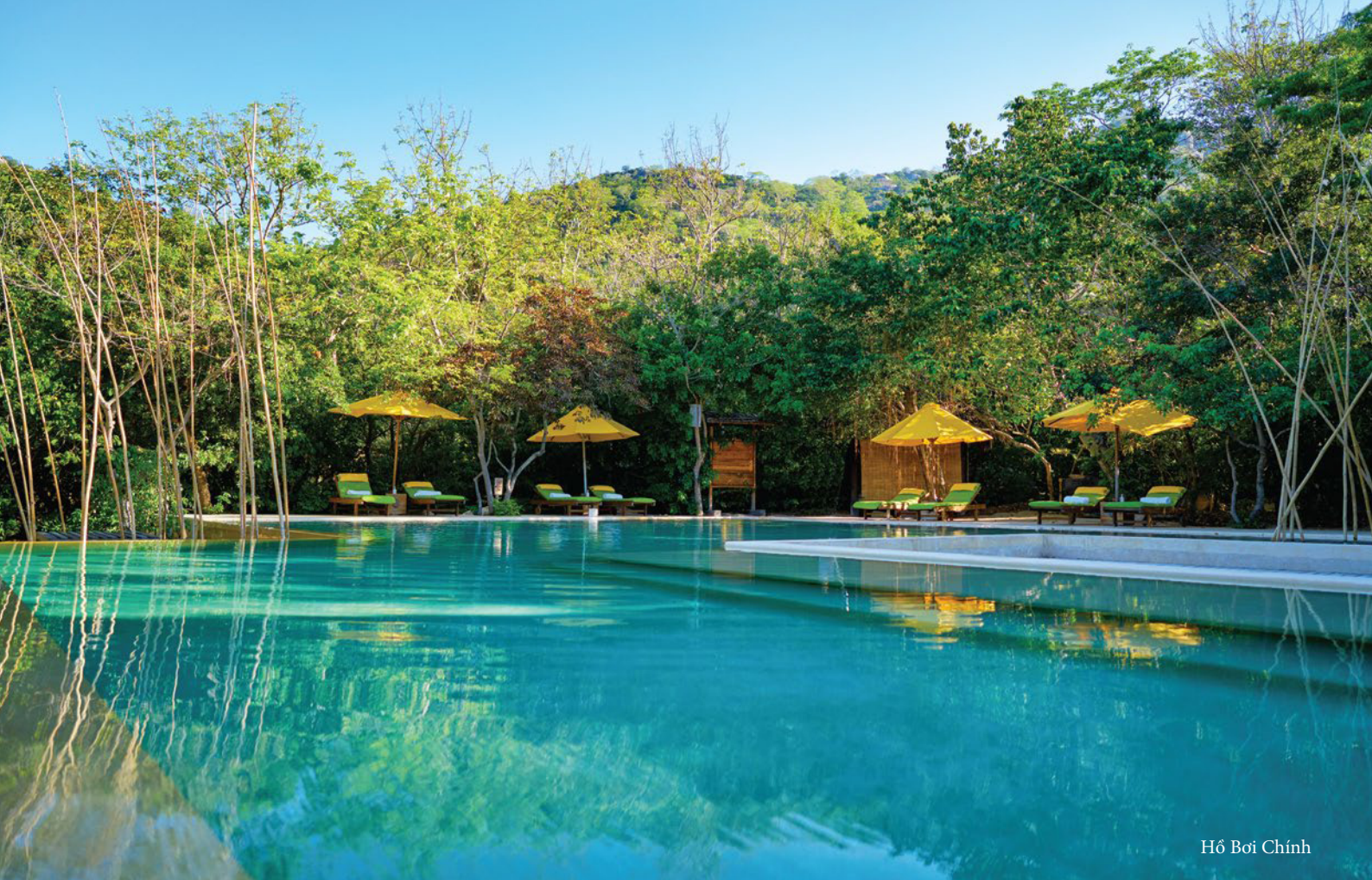
Hồ Bơi Chính