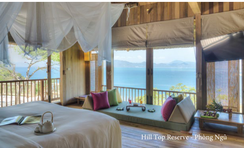
Hill Top Reserve - Phòng Ngủ