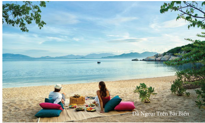
Đã Ngoại Trên Bãi Biển

Sẵn sàng cho một chuyến đi lặn ngắm rạn san hô tuyệt đẹp tại Six Senses Ninh Van Bay. Rạn san hô được khu nghỉ bảo tồn và tái tạo bởi đội ngũ chuyên gia, trải dài từ Trung tâm Giải Trí (Experience Center) cho đến các biệt thự gần khu vực nhà hàng Dining by the Bay. Xuyên suốt chuyến lặn luôn có sự đồng hành của hướng dẫn viên để đảm bảo một hành trình an toàn và dẫn đường cho bạn đến những điểm đẹp nhất của rạn san hô.