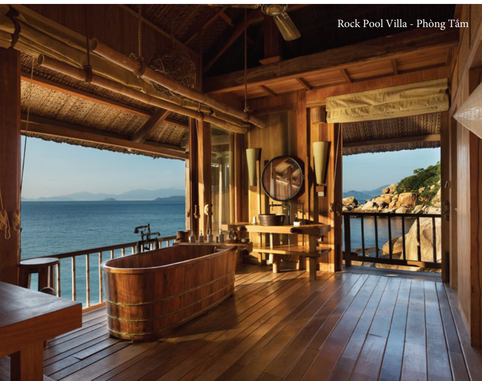
Rock Pool Villa - Phòng Tắm