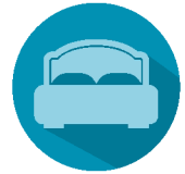
Giờ đi ngủ