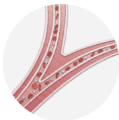
Mạch máu bị PAH

Khi bị PAH, cơ thể không sản xuất đủ prostacyclin, một chất tự nhiên giúp mạch máu của bạn mở và hoạt động bình thường.