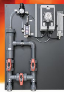
Panneau de pré-conditionnement d'échantillon