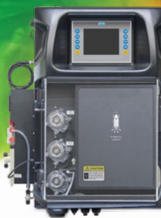
Analyseur par chimiluminescence